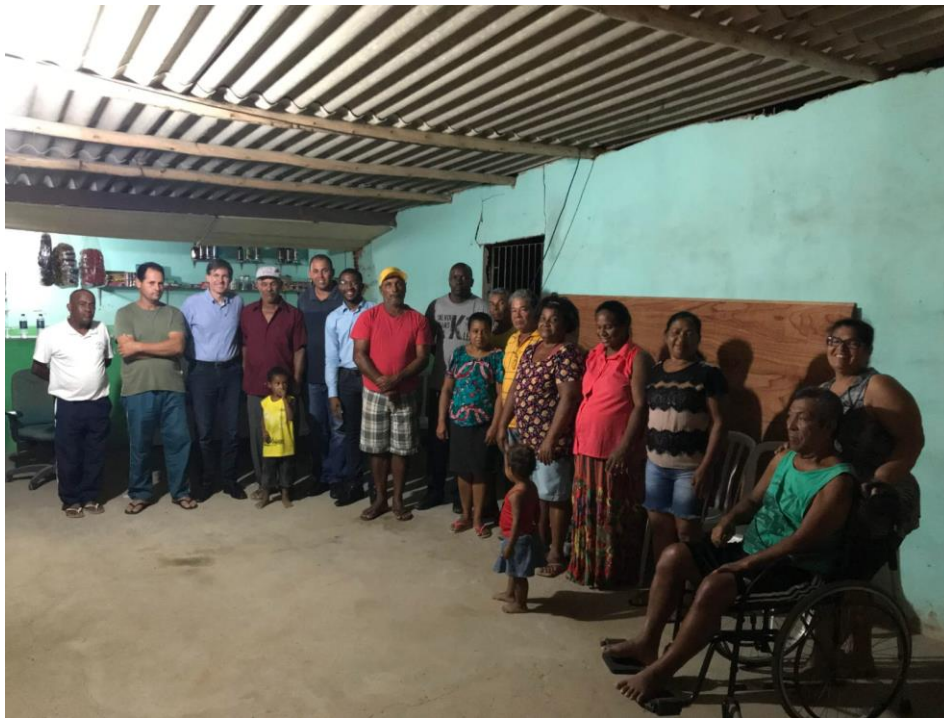
Foto1: Comunidade Gameleira

Alguns Registros fotográficos das reuniões que aconteceram nas comunidades atingidas, exposição das condições de vida e agravados após o rompimento da barragem e levantamento das necessidades para reparação dos danos causados na vida das comunidades e exposição do Plano de Saúde de São Mateus-ES.