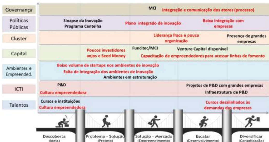
Figura 1: Pontos positivos e gargalos na Trilha da Inovação Capixaba.

O relatório “Planejamento do Ecossistema de Inovação da Grande Vitória” elaborado por meio de metodologias de suporte à estruturação de habitats de inovação da Fundação CERTI, ilustra os resultados do planejamento do ecossistema e trilha da inovação da Grande Vitória. (CERTI, 2019). Uma das etapas, demonstra os pontos positivos (em preto) e os gargalos (em vermelho), identificados na Trilha de Inovação Capixaba.