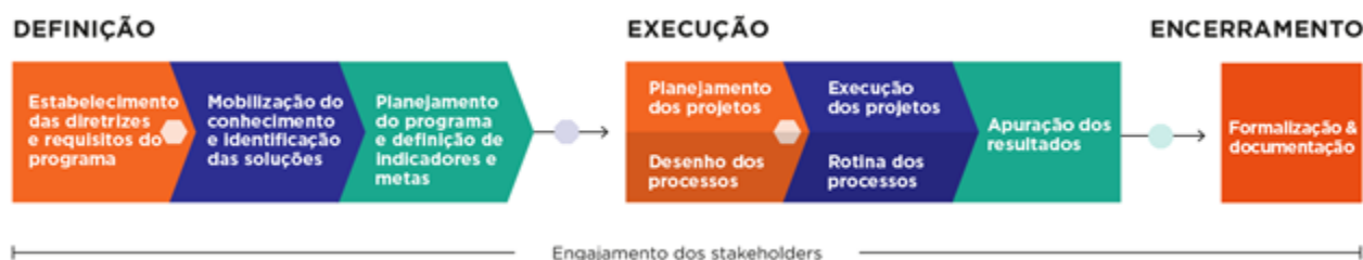
Figura 1: Ciclo de vida dos programas

A figura abaixo demonstra a abordagem metodológica utilizada no desenvolvimento dos programas que estão sob responsabilidade da Fundação Renova.