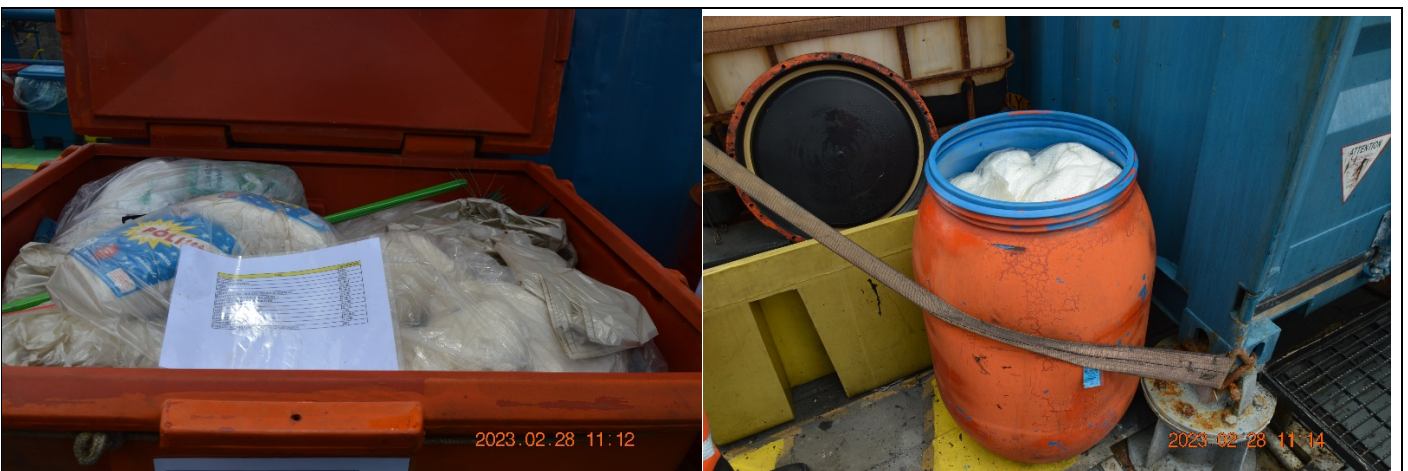
Kits Sopep com lista de materiais