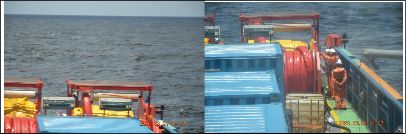
Barreira e exercício- Lançamento