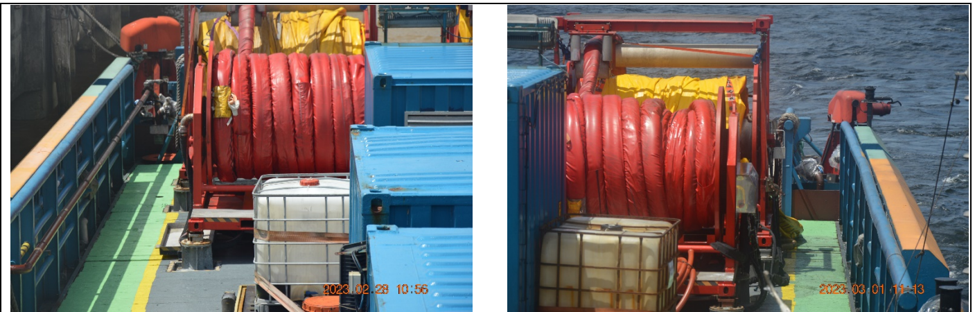
Barreira e exercício