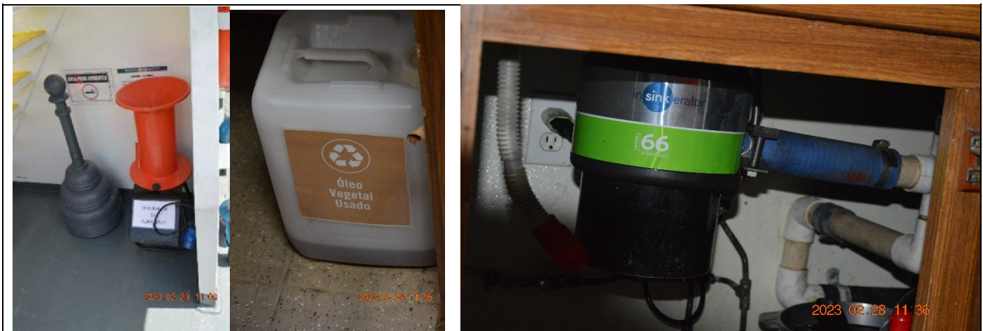
Container de óleo de cozinha triturador e seu reserva