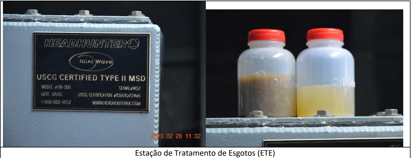
Estação de Tratamento de Esgotos (ETE)

1 – Efluentes Sanitários, 2 – Tanques para conteúdos oleosos e Separador de Água e Óleo (SAO)