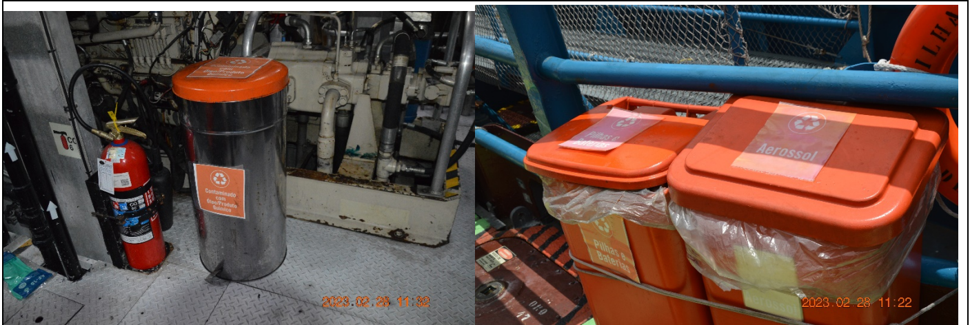
Exemplos de segregação de resíduos perigosos