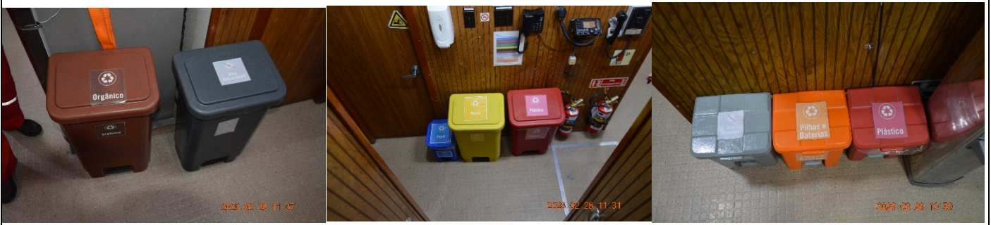
Exemplos de segregação de acordo com a Conama n 275/01