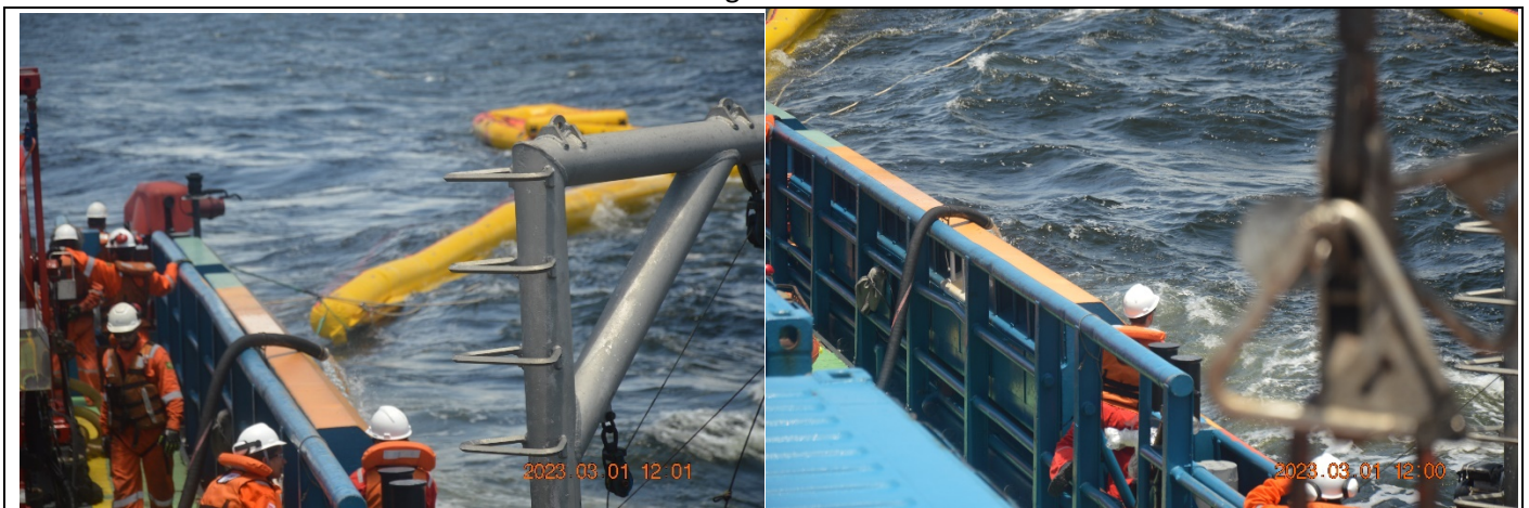
Barreira e exercício – Mangote de bombeamento