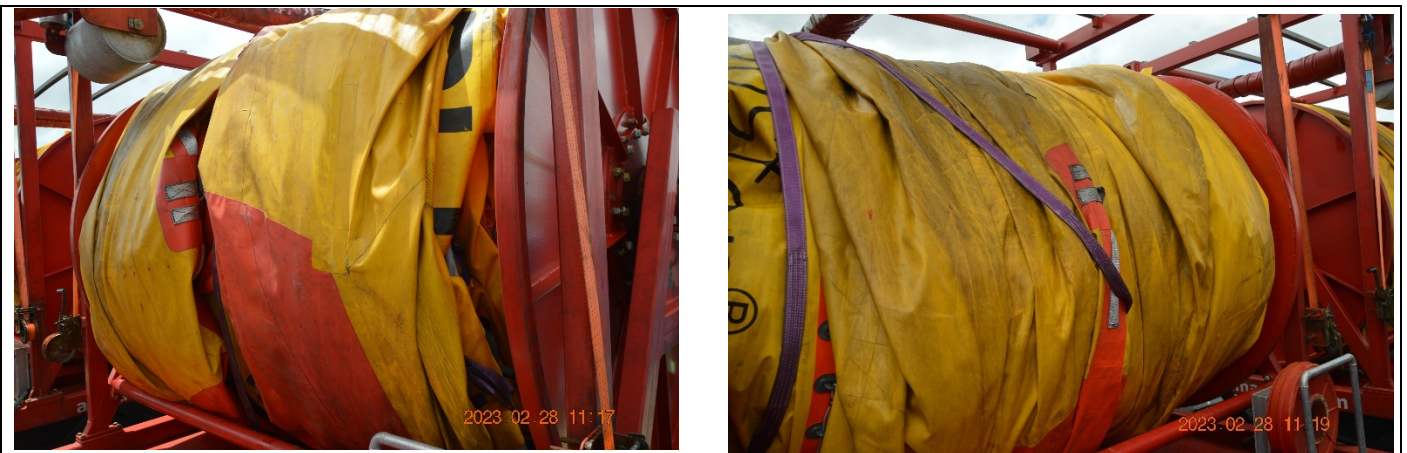
Barreira e exercício - lançamento