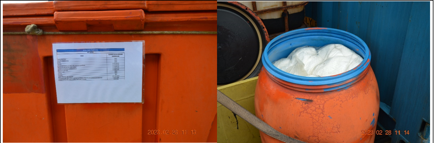
Kits Sopep com lista de materiais