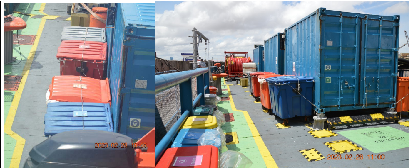
Exemplos de segregação de acordo com a Conama n 275/01