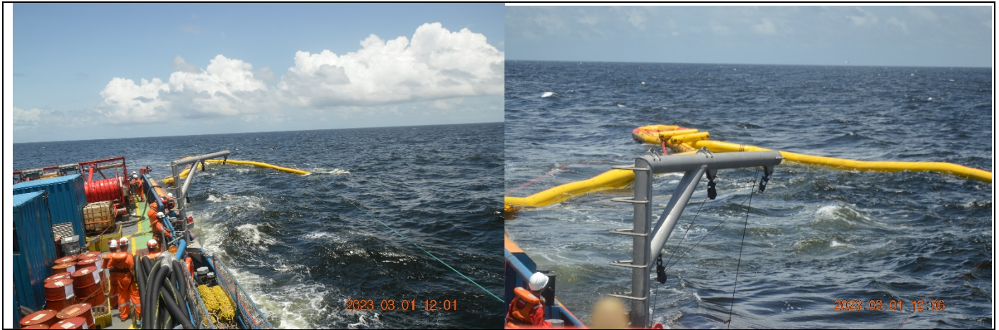
Barreira e exercício – Formação