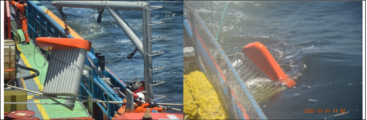
Barreira e exercício – Lançamento