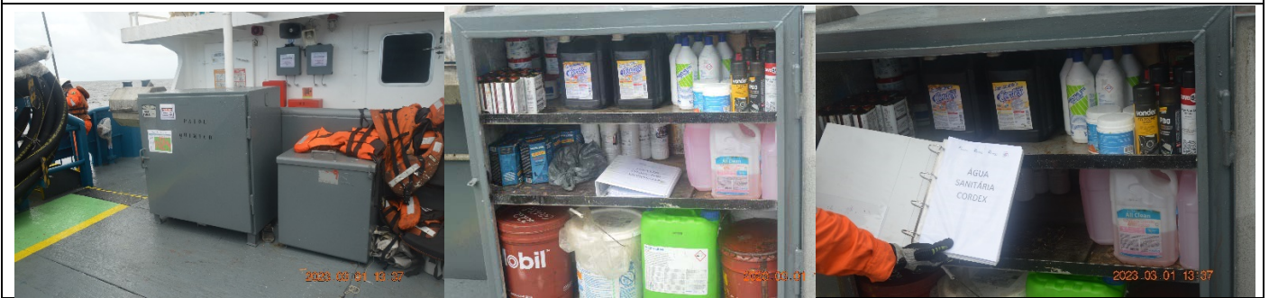
Produtos Químicos e livro de FISPQ