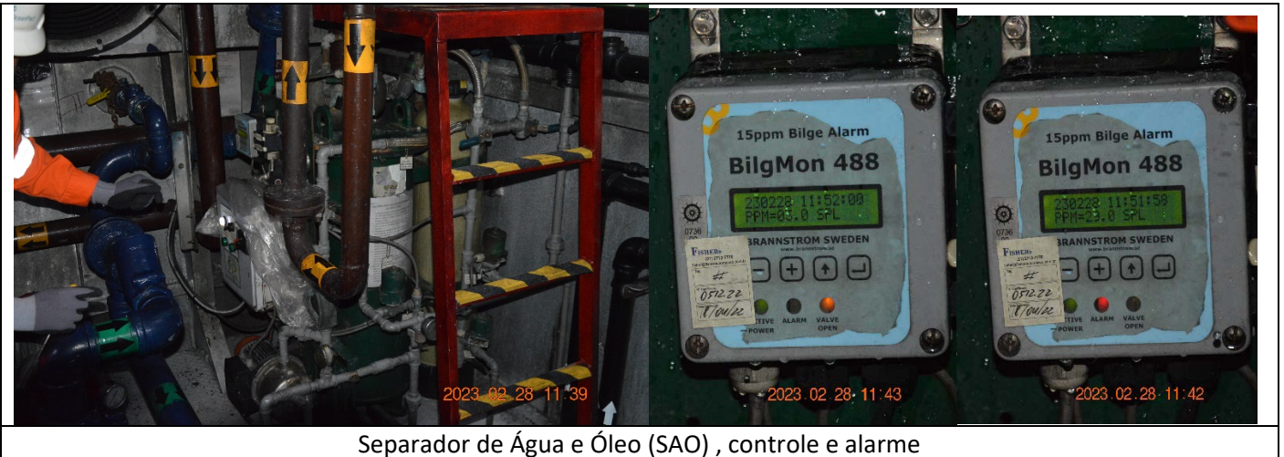
Separador de Água e Óleo (SAO), controle e alarme