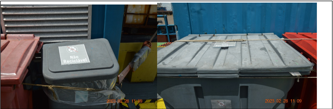
Exemplos de segregação de acordo com a Conama n 275/01