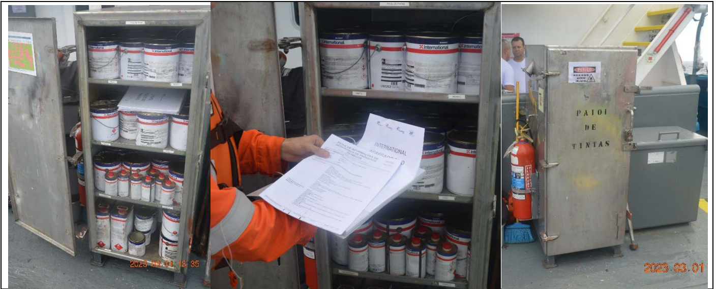
Paioi de tintas e livro de FISPQ