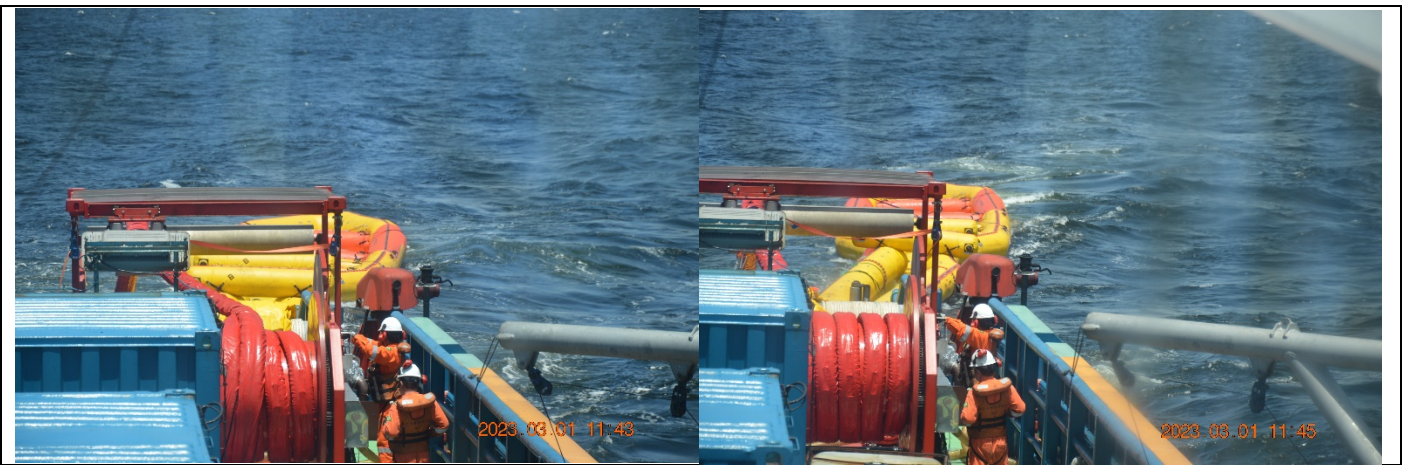
Barreira e exercício- Lançamento