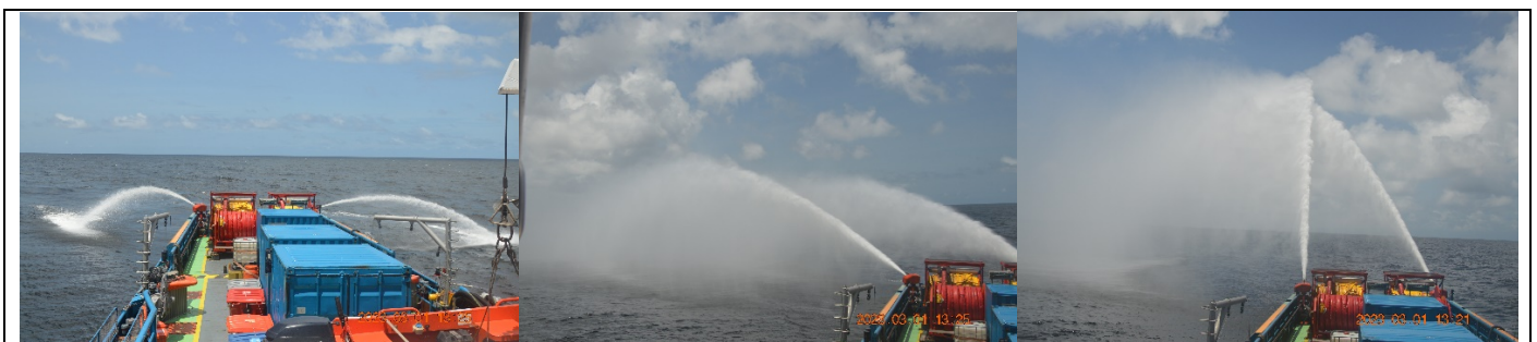
Acionamento – Fifi