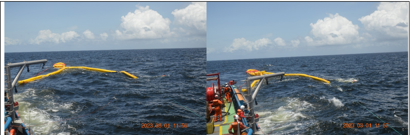
Barreira e exercício – Formação