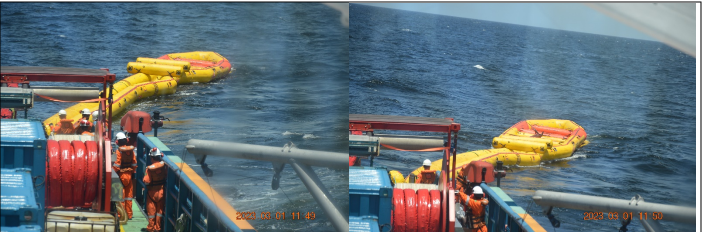
Barreira e exercício - Lançamento