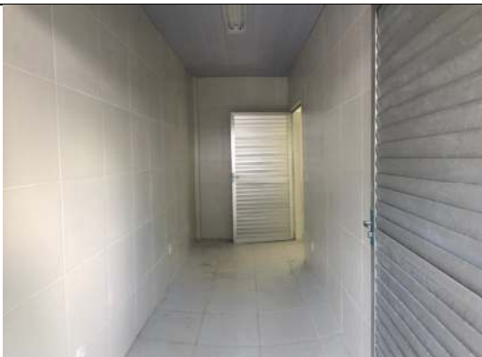
Bloco #1 – Sala da Lavanderia.