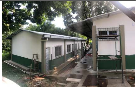
Visão dos Bloco #1 e 2