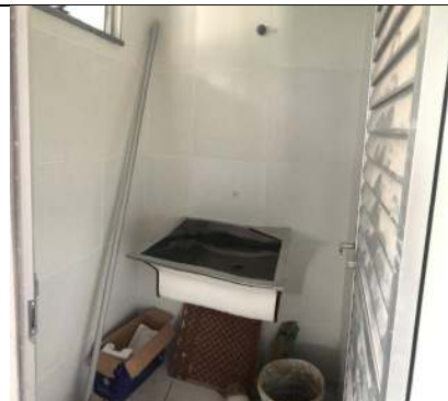
Bloco #1 – Sala da Lavanderia.