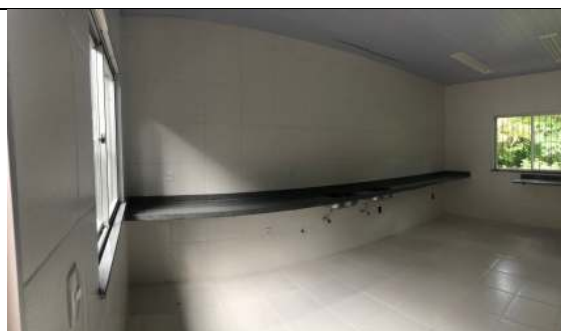
Sala de Preparação dos Alimentos. Bloco #2