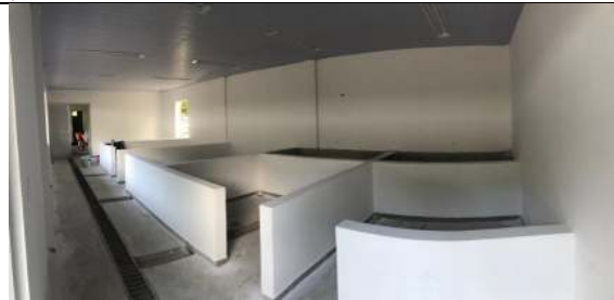
Bloco #1 Tanques