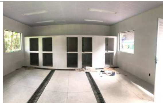
Bloco #2 – Sala de Tratamento