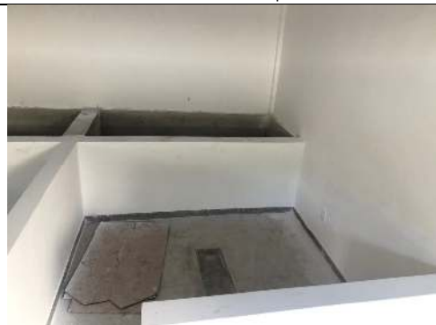
Bloco #1 - Tanques