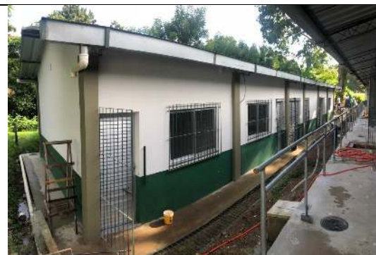
Visão do Bloco #2