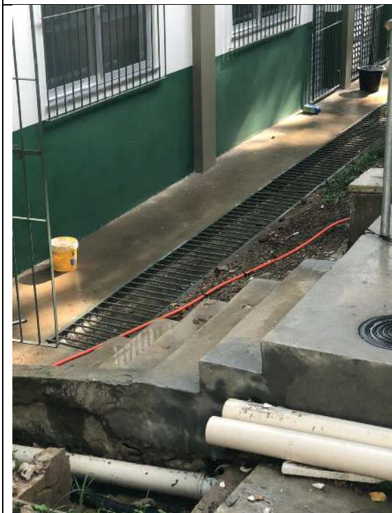
Acesso do Bloco #1 para 2.