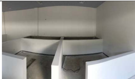
Bloco #1 - Tanques