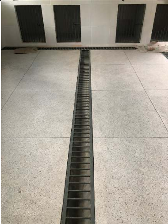
Bloco #2 – Sala de Tratamento.