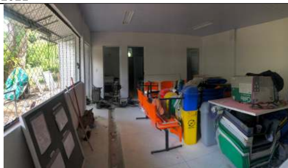
Salão e Acesso aos Lavabos