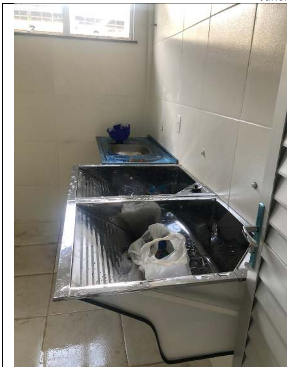
Lavanderia, tanques – Bloco #1