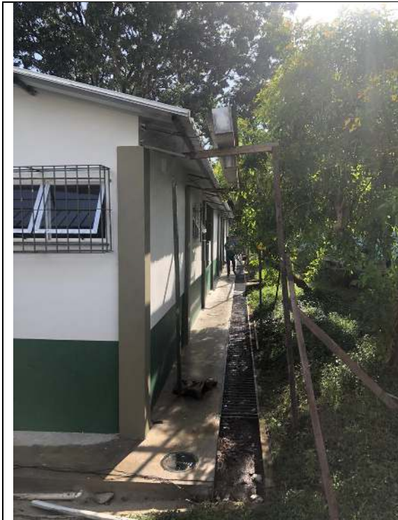
Visão Lateral Bloco #1