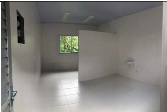
Sala de Consulta.