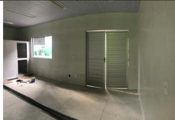
Bloco #2 – Sala de Tratamento