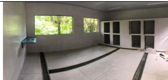
Bloco #2 – Sala de Tratamento