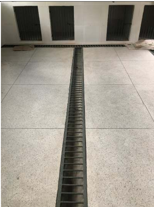
Bloco #2 – Sala de Tratamento