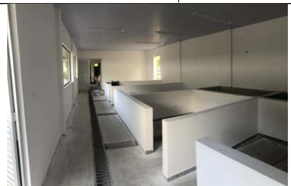
Bloco #1 – Tanques