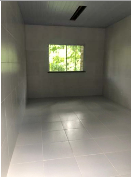
Depósito Bloco #2