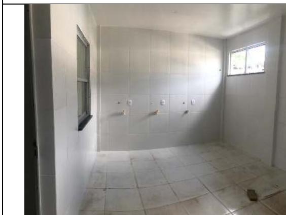
Lavanderia – Bloco #1