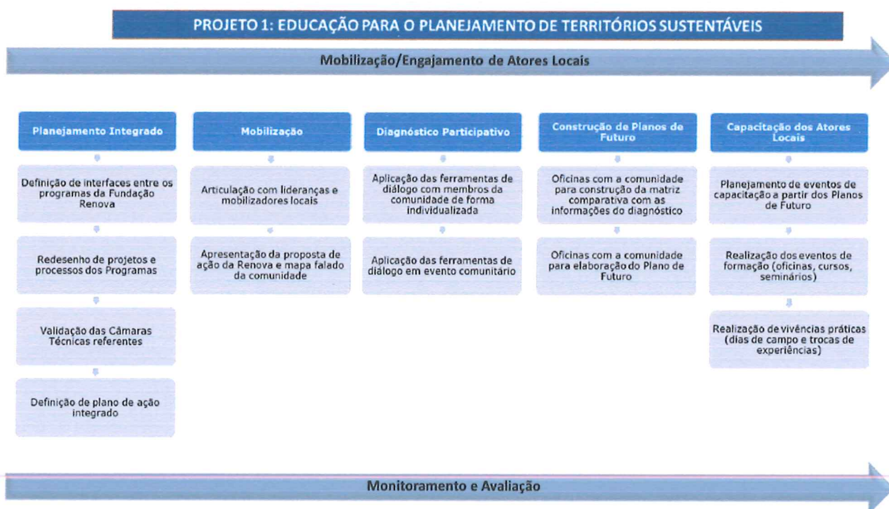
Figura 1: Principais etapas do Processo Interfaces de Educação para o Planejamento de Territórios Sustentáveis.