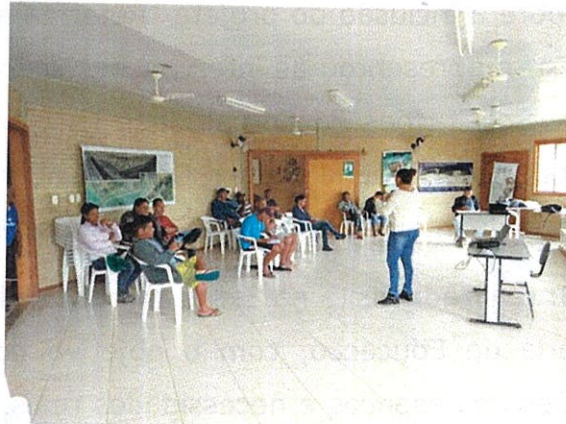
Figura 2: Reunião de validação final do Projeto em 28/08/2018.

A escola possui atualmente uma estrutura precária, fora dos padrões estipulados pelo MEC, além de não ter mobiliário adequado que suporte as necessidades de atendimento dos alunos. A solicitação da comunidade escolar está relacionada no Anexo II. O Projeto de Engenharia contemplou as solicitações da comunidade escolar e os padrões do MEC, e estão no Anexo III.