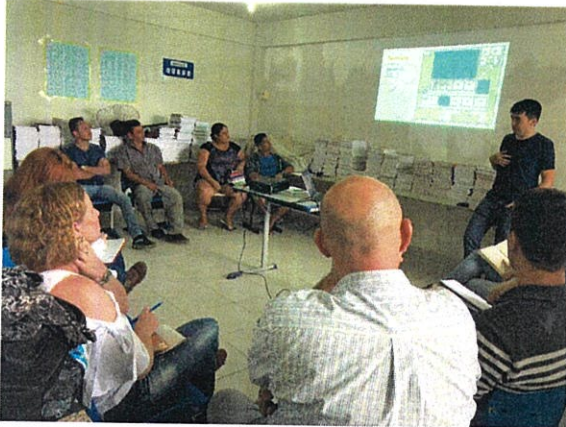
Figura 1: Reunião de apresentação do Projeto de reestruturação para Diretoria, Conselho Escolar e Secretaria Municipal de Educação em 24/07/2018.