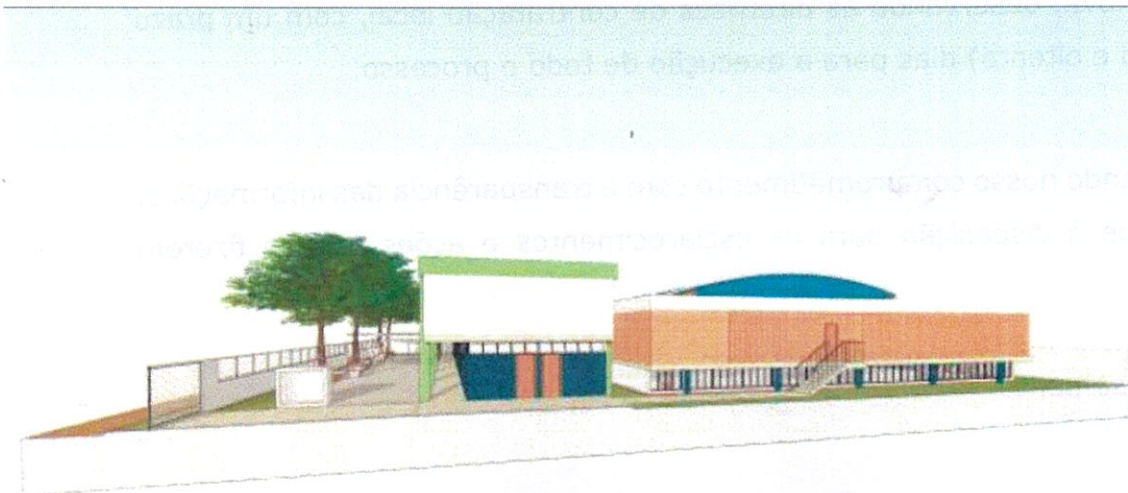
Figura 8: Perspectiva da fachada lateral direita.

O projeto apresentado e aprovado pela comunidade escolar prioriza a setorização dos ambientes, gerando espaços integrados, promovendo acessibilidade ao portador de deficiência e valoriza o espaço de chegada à escola. Os espaços interno e externo são pensados para a melhoria das práticas pedagógicas e ao desenvolvimento infantil.