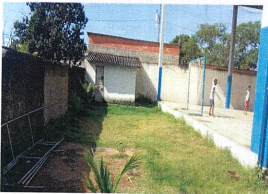
Figura 3: Anexos próximos aos muros sem o afastamento mínimo necessário.

A escola possui atualmente uma estrutura precária, fora dos padrões estipulados pelo MEC, além de não ter mobiliário adequado que suporte as necessidades de atendimento dos alunos. A solicitação da comunidade escolar está relacionada no Anexo II. O Projeto de Engenharia contemplou as solicitações da comunidade escolar e os padrões do MEC, e estão no Anexo III.