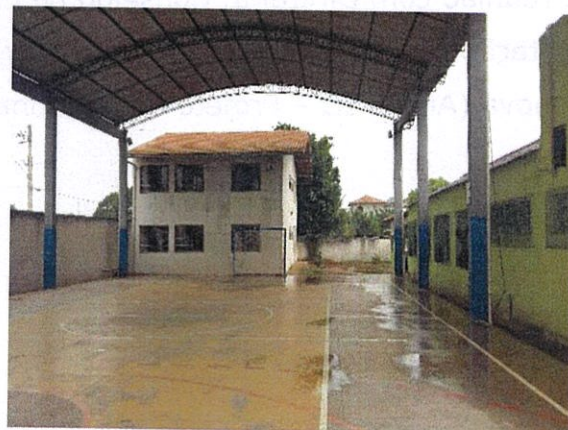
Figura 4: Quadra com cobertura ineficaz, muito próximo das salas de aulas.