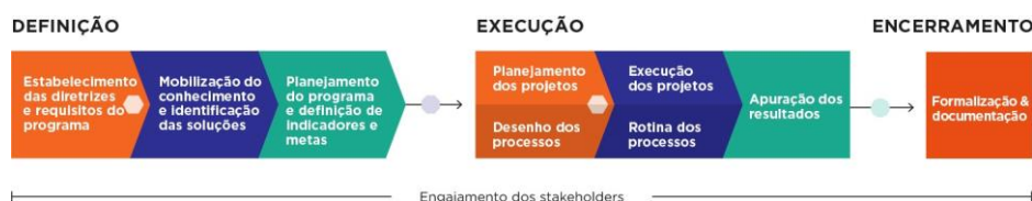
Figura 1- Ciclo de vida do Programa

A figura abaixo demonstra a abordagem metodológica utilizada no desenvolvimento dos programas que estão sob responsabilidade da Fundação Renova (Fundação).