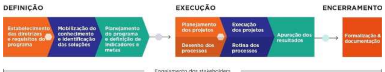
Figura 1- Ciclo de vida do programa

A figura abaixo demonstra a abordagem metodológica utilizada no desenvolvimento dos programas que estão sob responsabilidade da Fundação Renova.