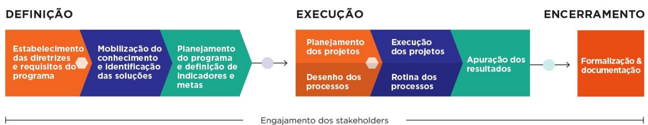
Figura 1- Ciclo de vida do programa

A figura abaixo demonstra a abordagem metodológica utilizada no desenvolvimento dos programas que estão sob responsabilidade da Fundação Renova (Fundação).