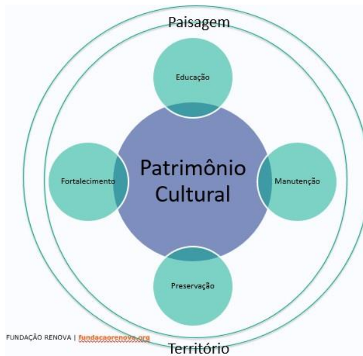
Figura 3 - Diretrizes Patrimônio Cultural

qual a sua transmissão incorpora possibilidades de mudança, incorporando as variações trazidas pelo tempo. Sendo observado, através das análises já realizadas, dois fatores que resultam nas variáveis: mudanças resultantes de transformações internas dos grupos, baseadas nas ressignificações, e daquelas elencadas a fatores bruscos, no caso, o rompimento da barragem, suas consequências e deslocamento no território.