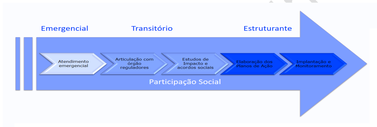
Figura 2- Solução do Programa por fase

O diagrama 01 relaciona a construção da solução com as fases e o avanço do programa.