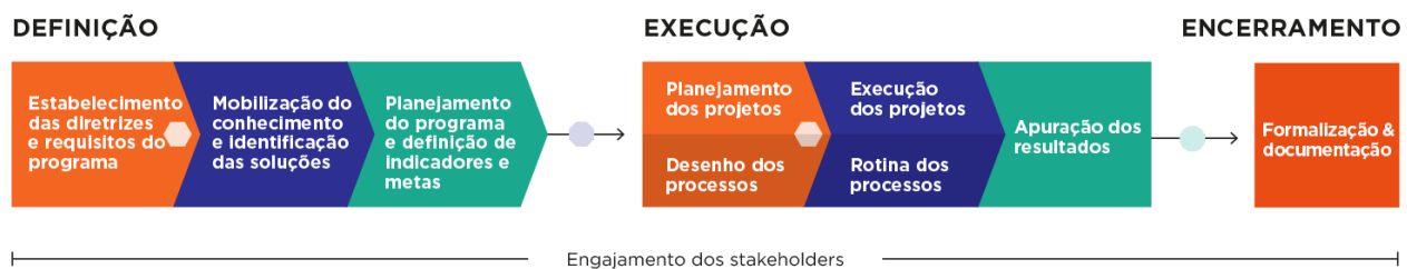
Figura - Ciclo de vida do programa

A figura abaixo demonstra a abordagem metodológica utilizada no desenvolvimento dos programas que estão sob responsabilidade da Fundação Renova (Fundação).