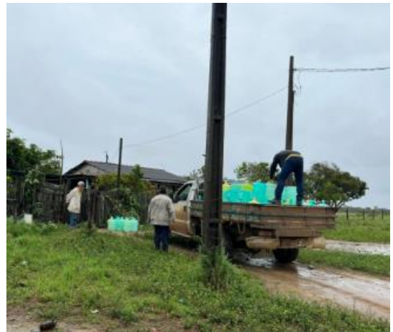
Imagens dos galões de água para entrega nas residências.