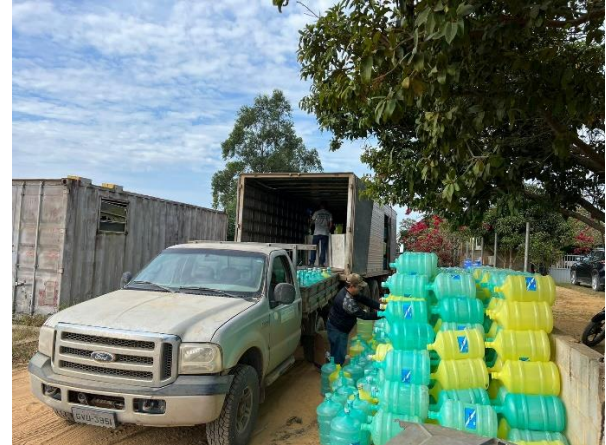
Imagens dos galões de água para entrega nas residências.