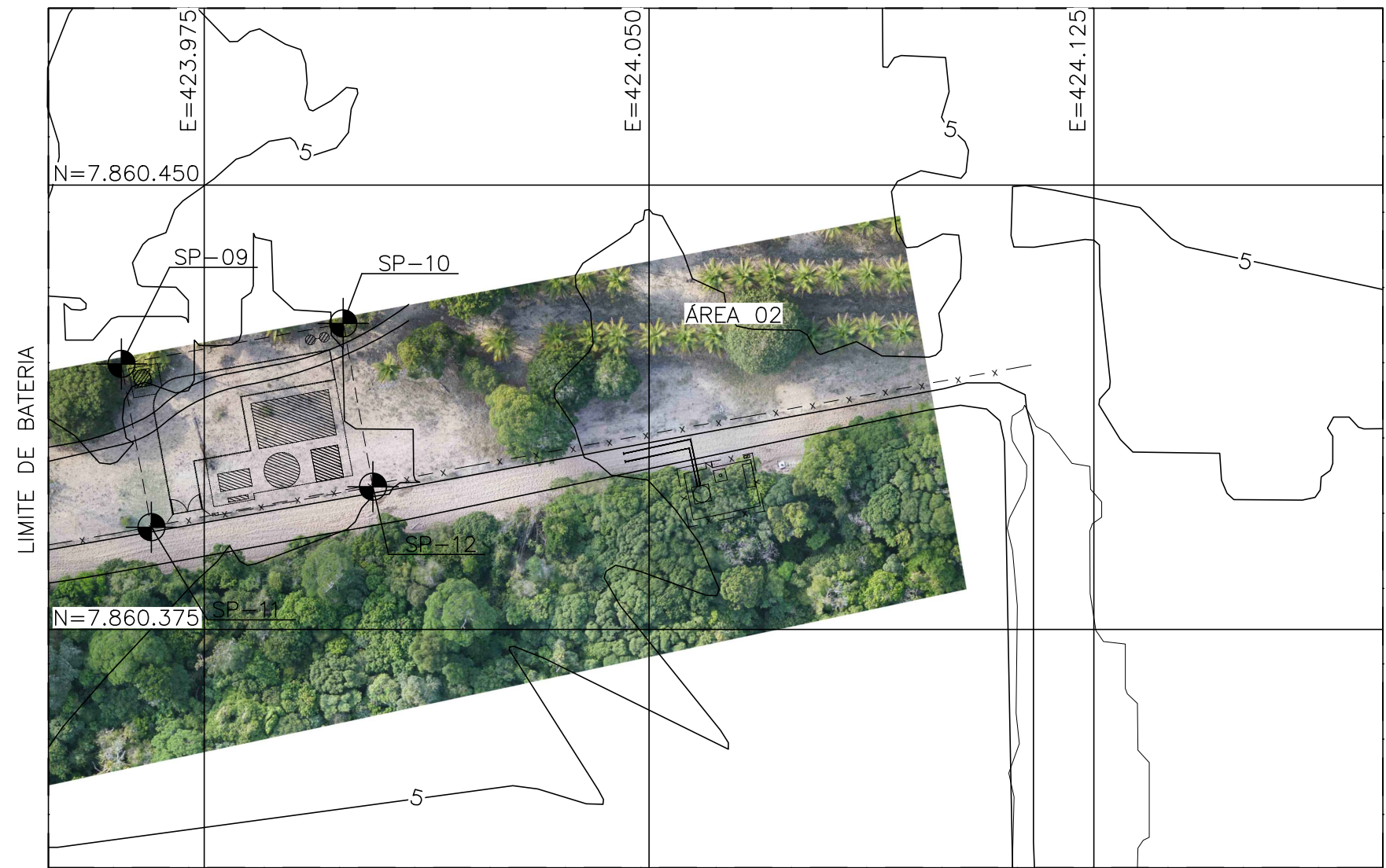
PLANO DE SONDAGENS – ÁREA 2 ESCALA 1:1000