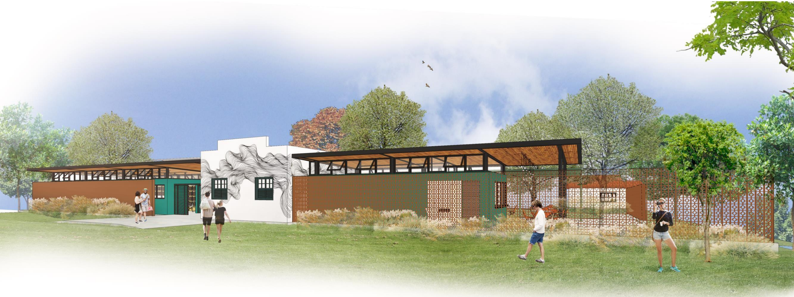
Fachada Frontal (rua)