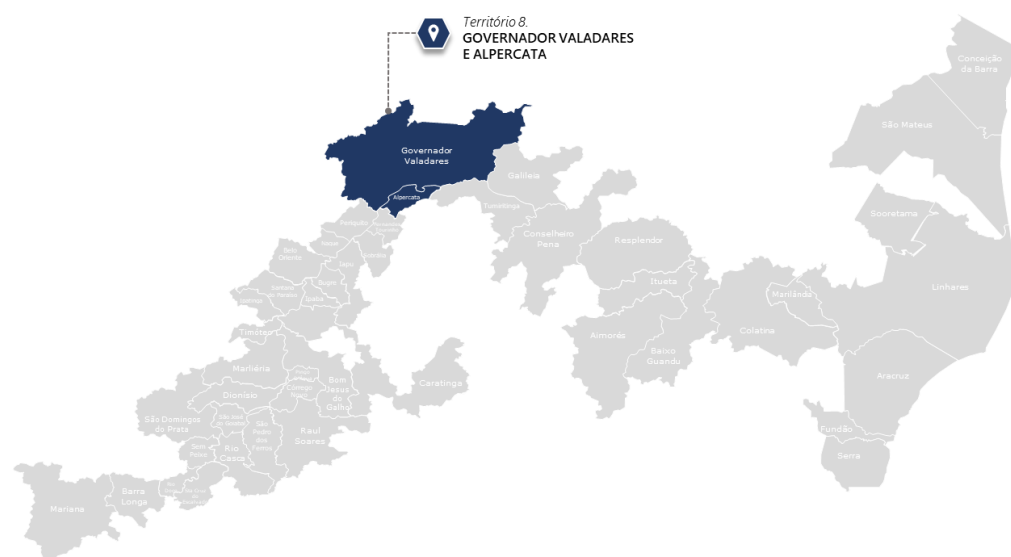
Mapa 1. Microterritório Governador Valadares e Alpercata

Governador Valadares e Alpercata estão localizados no macroterritório do Médio Rio Doce e, apesar da diferença de porte municipal, experimentaram impactos similares decorrentes do vazamento dos rejeitos no rio Doce. Os municípios, seus distritos e comunidades locais relatam insegurança a respeito da qualidade da água para consumo. Em períodos chuvosos, as enchentes provocam alagamento de casas ribeirinhas em Ilha Brava, e em Governador Valadares (sede). Neste último, somam-se os impactos na cadeia produtiva da pesca e agricultura, no comércio, turismo e extração de areia. O reservatório da Usina Hidroelétrica de Baguari não sofreu um processo de assoreamento tão grave quando o da UHE de Candonga, mas suas águas apresentaram níveis elevados de turbidez após o rompimento. A jusante da represa de Baguari, houve depósito de pluma de rejeitos na planície de inundação. Este trecho era o mais populoso do curso do rio, impactando no fornecimento de água à população de ambos os municípios. Em Alpercata, os danos do rompimento estão relacionados, principalmente ao desabastecimento de água na cidade e aos impactos nas cadeias produtivas da pesca e agricultura.