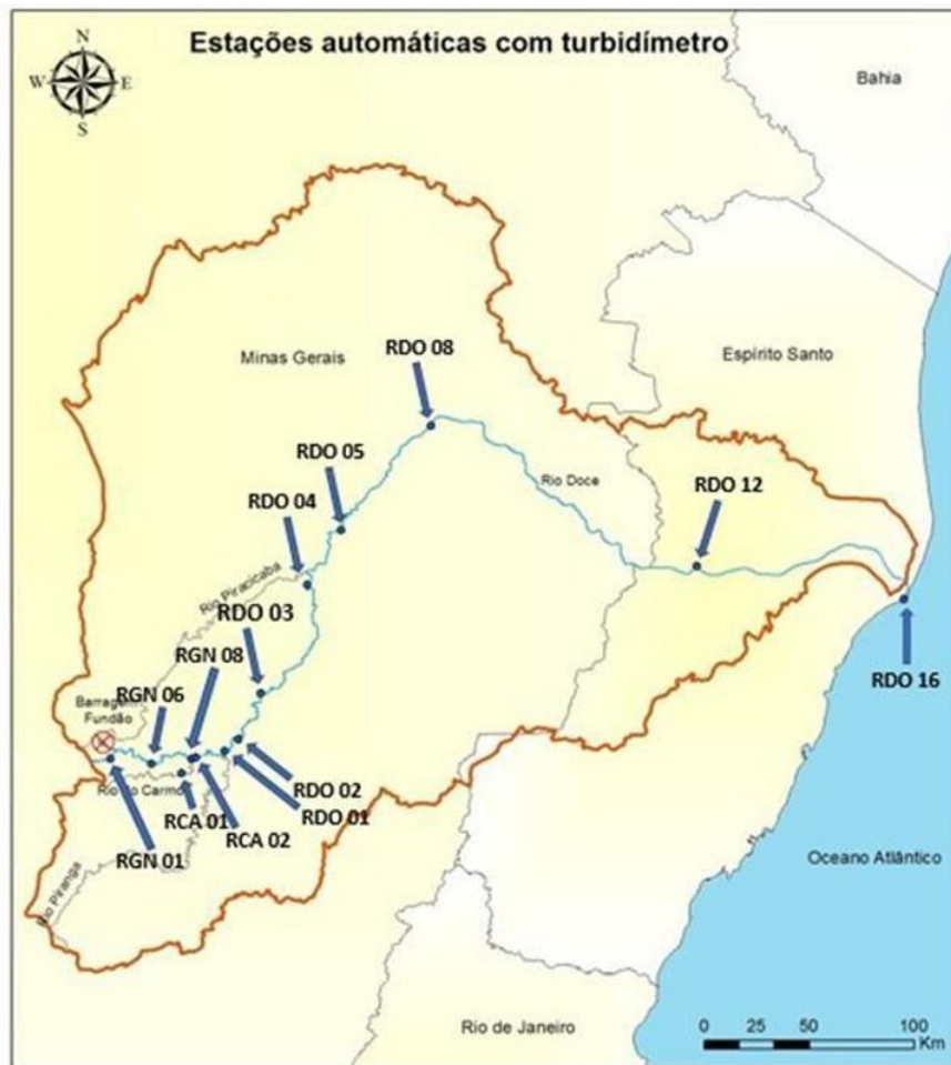
Figura 1: Localização das estações