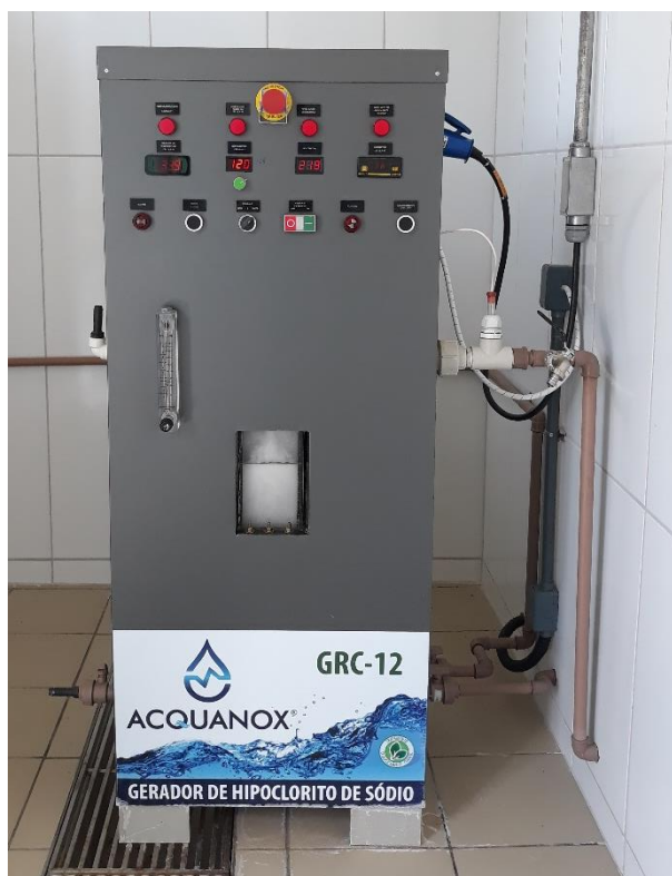
Máquina Geradora de Hipoclorito de Sódio

O comissionamento da máquina geradora de hipoclorito de sódio foi feito no mesmo dia do treinamento dos Operadores da ETA, Químico Responsável do SAAE, Químico da Fundação Renova e Diretor do SAAE de Galileia, conforme lista de presença anexa.