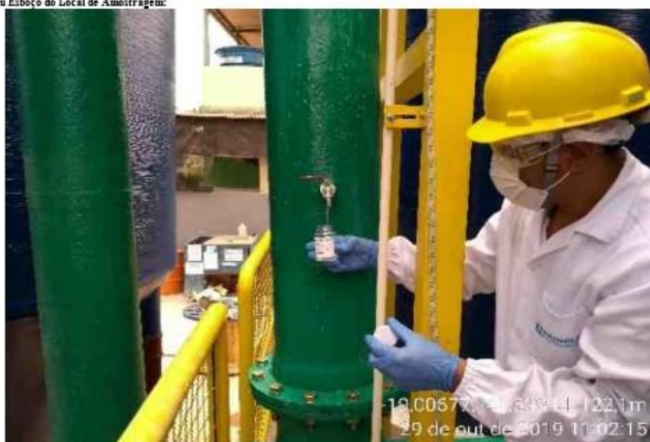
Fotografia, Diagrama ou Esboço do Local de Amostragem: