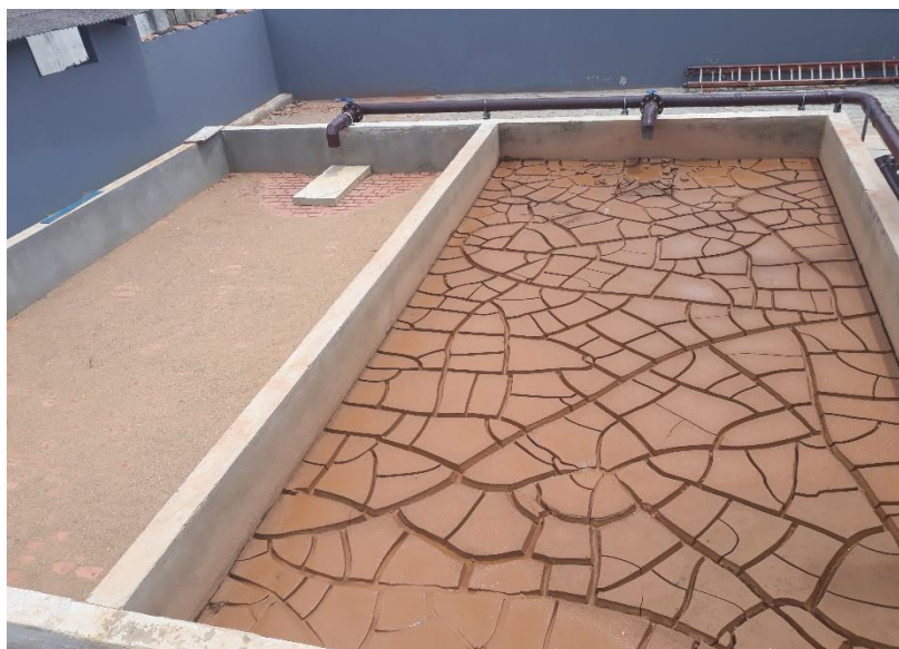
Leito de secagem da UTR

Uma vez por dia o operador faz a drenagem do sobrenadante dos adensadores e envia esse volume ao tanque da estação elevatória EER-02. Logo após essa operação, é feita a abertura da válvula manual dos adensadores para descarregar a lama de fundo no leito de secagem, que ocorre de forma natural, sendo que o filtrado do leito é enviado ao tanque da elevatória EER-01. São dois leitos de secagem e a operação é sempre com um leito recebendo as descargas dos adensadores e o outro leito em processo de secagem para a limpeza. Desde que a nova ETA entrou em operação, estamos operando apenas com um leito que está próximo de atingir os 100% de capacidade.