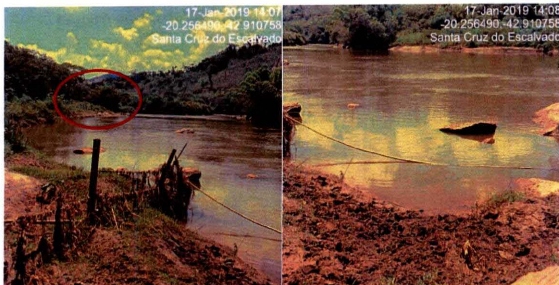
Figura 02 – Foto do novo local previamente autorizado para a instalação da estação automática RDO01, com destaque em vermelho da estação atual.

Assim, a FUNDAÇÃO informou a necessidade de alteração deste ponto da estação automática de monitoramento RDO 01 para conhecimento e manifestação do GTA-PMQQS, sendo certo que a autorização para intervenção em APP será devidamente solicitada à Secretaria de Estado de Meio Ambiente e Desenvolvimento Sustentável (SEMAD) antes da alteração na estrutura da estação automática.