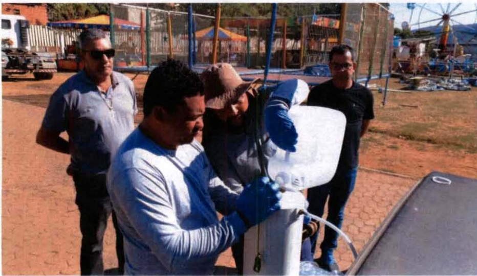
Figura 01 – Representantes da Prefeitura acompanhando a coleta no ponto de monitoramento RDO 10, localizado em Resplendor – MG.

No dia 09 de agosto de 2019 ocorreu a primeira coleta naquele município, acompanhada pelos representantes da Prefeitura, conforme evidenciado nas figuras abaixo.