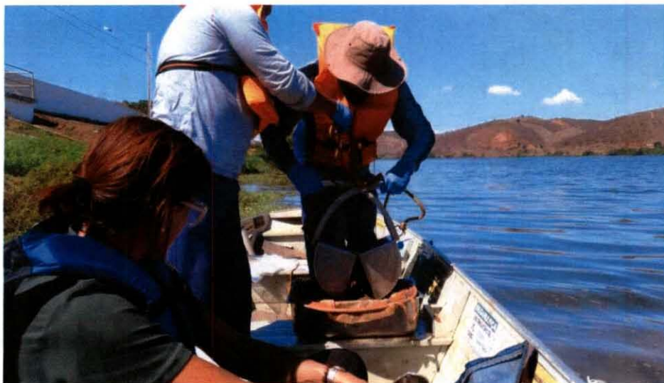
Figura 04 – Representantes da Prefeitura acompanhando a coleta no ponto de monitoramento RDO 10, localizado em Resplendor – MG.

A Fundação informa ainda que todos os laudos aprovados estão à disposição da Prefeitura de Resplendor e serão enviados sempre que solicitado.