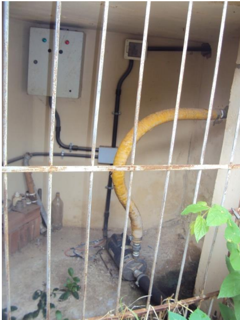
Figura 9 - Estação Elevatória do Sistema Aimorés no Morro do Anésio (Local: 24K 0281454 7842822/Altitude: 117 m).

Fonte: Fundação Educacional de Caratinga - FUNEC, 2013.