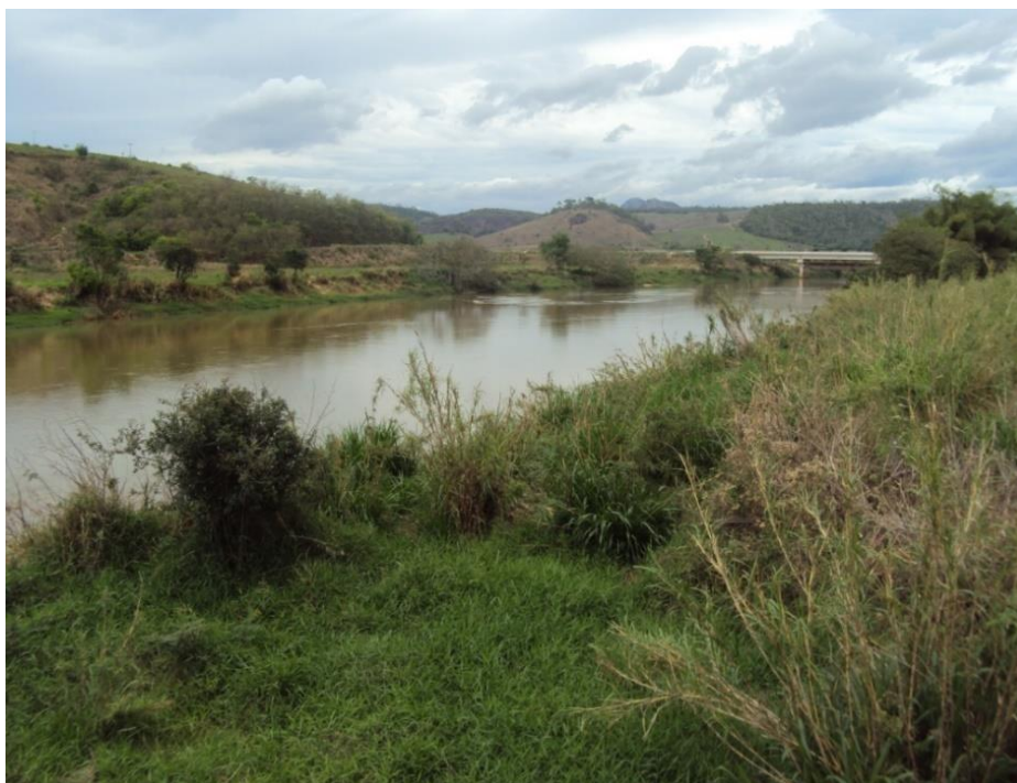
Figura 3 - Local de Captação no rio Manhuaçu (Local: 24K 0279712 7844239/Altitude: 88 m)

Fonte: Fundação Educacional de Caratinga - FUNEC, 2013.