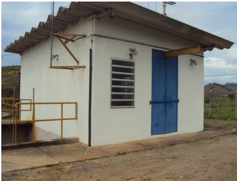
Figura 7 - Casa de Bombas (Local: 24K 0279712 7844239/Altitude: 88 m).

Fonte: Fundação Educacional de Caratinga - FUNEC, 2013.