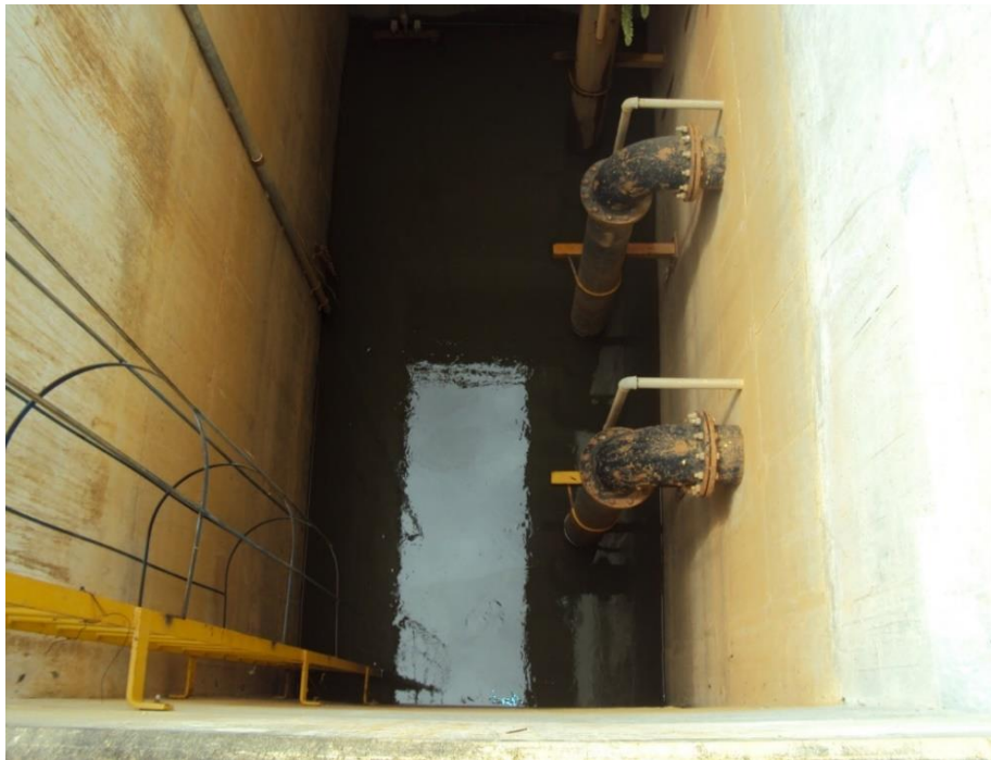
Figura 6 - Aspecto visual do bombeamento da água (Local: 24K 0279712 7844239/Altitude: 88 m).

Fonte: Fundação Educacional de Caratinga - FUNEC, 2013.