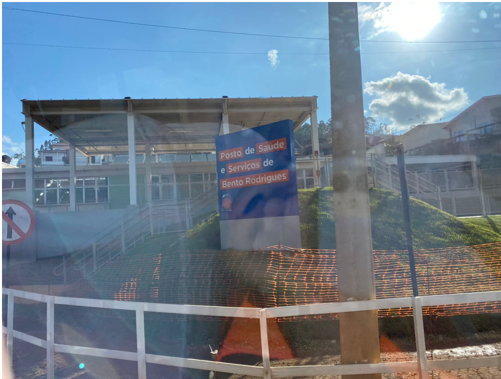
Foto 21 - Posto de Saúde e Serviços de Bento Rodrigues - entrada lateral