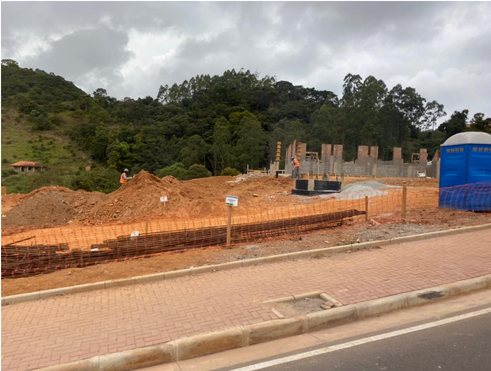
Foto 4 - Construção de casa no Reassentamento de Paracatu - casas mais avançadas próximo à Escola

obs: é possível verificar a impermeabilização simultânea à execução de alvenaria