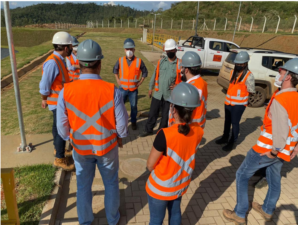
Foto 13 - ETE de Bento Rodrigues