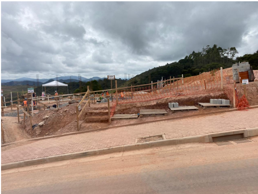
Foto 3 - Construção de casa no Reassentamento de Paracatu -