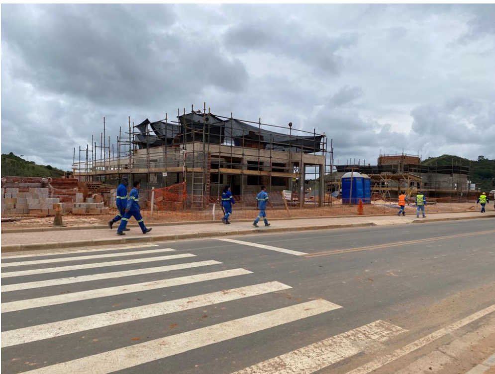
Foto 5 - Construção da Escola de Paracatu