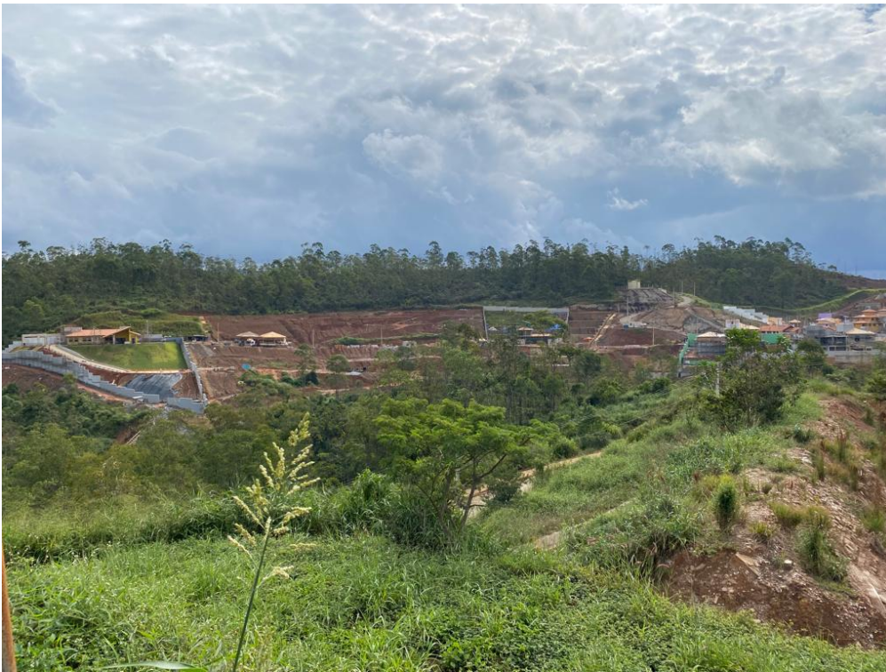
Foto 10 - Vista do Centro de Apoio ao Atingido de Bento Rodrigues