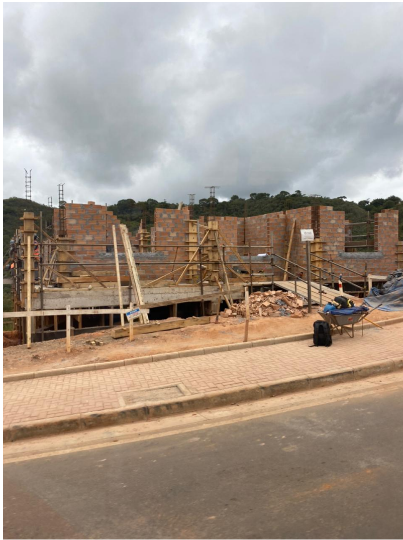
Foto 2 - Construção de casa no Reassentamento de Paracatu