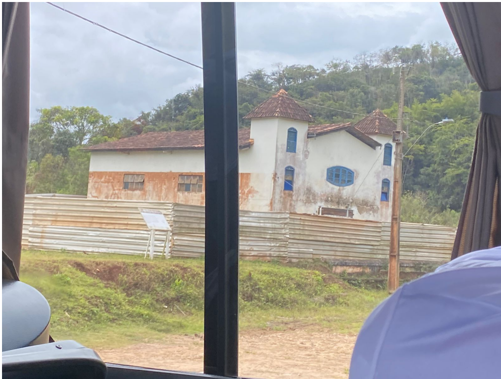
Fotos Bento Rodrigues

Obs: é possível ver a marca da lama que inundou a região