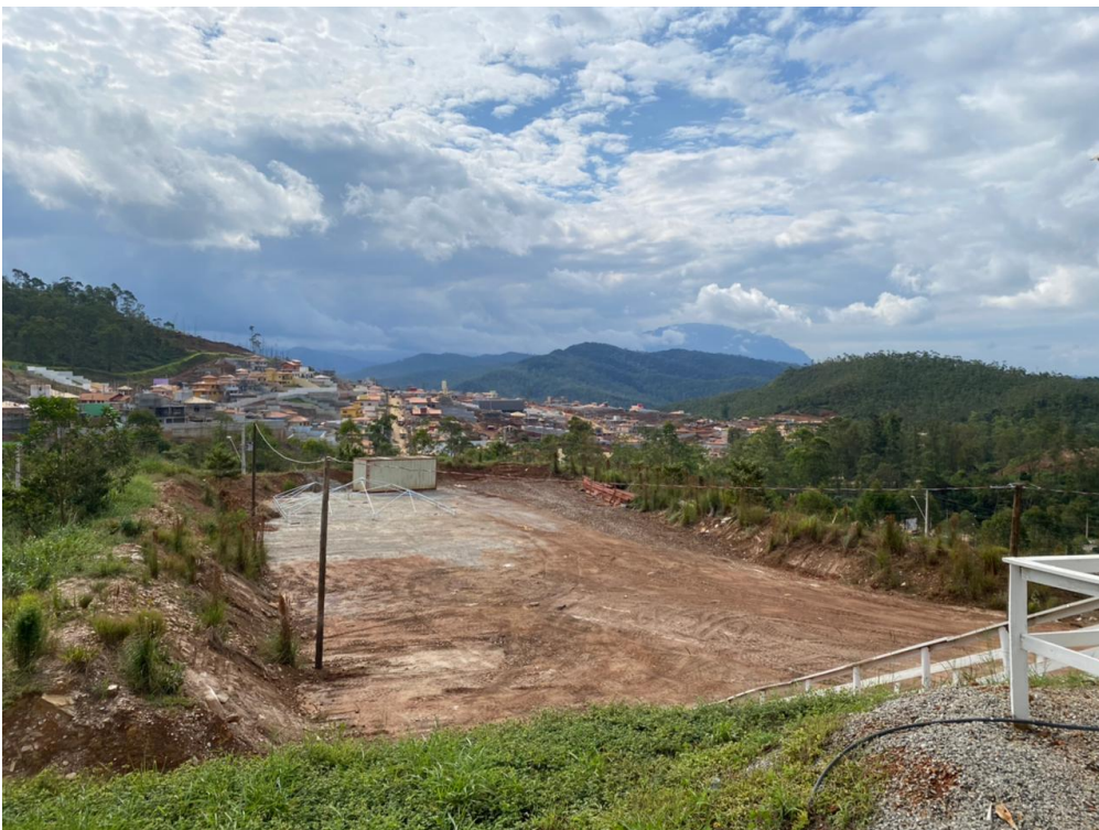
Foto 11 - Obras do Reassentamento de Bento Rodrigues