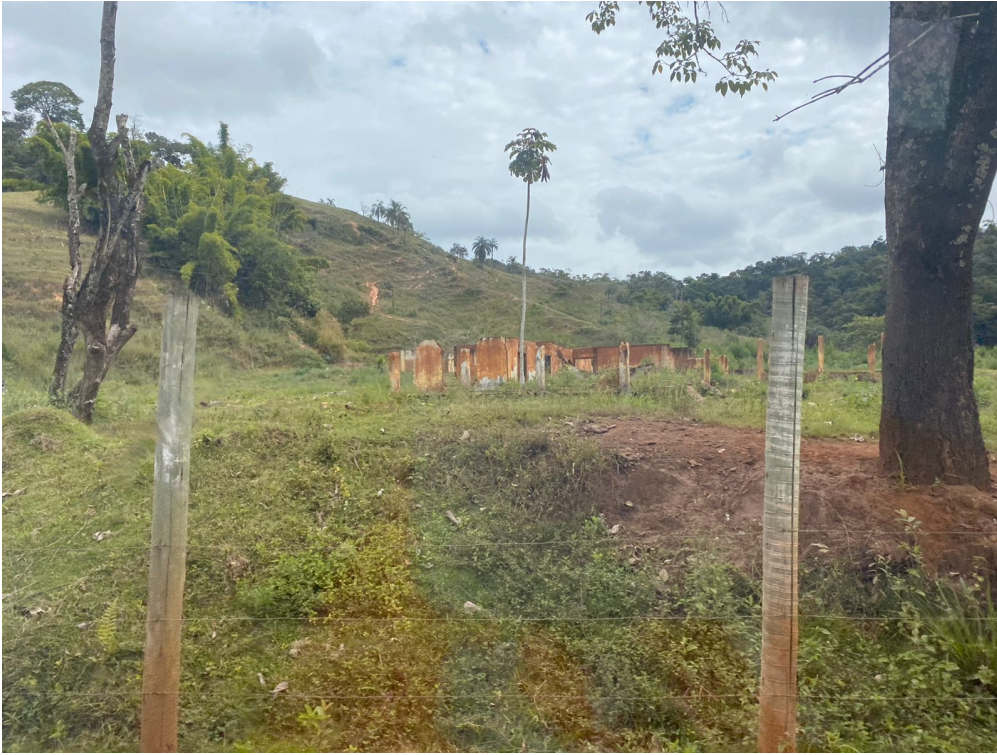
Foto 8 - Igreja de Paracatu - área atingida

Obs: é possível ver a marca da lama que inundou a região