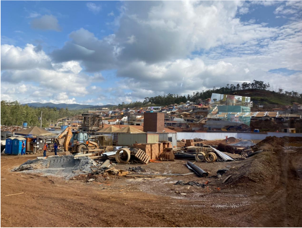
Foto 12 - Equipe da CT, Prefeitura de Mariana, EY e Renova na ETE de Bento