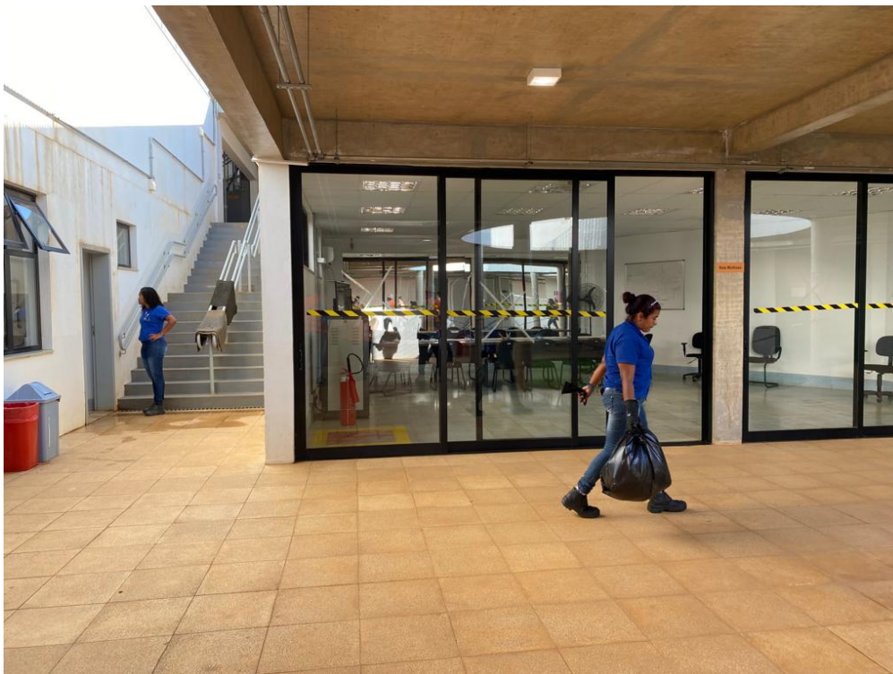
Foto 17 - Sala de aula da Escola

obs: está sendo utilizada pela Fundação Renova para administração do Reassentamento - a configuração das mesas deve mudar com o início das atividades da escola.