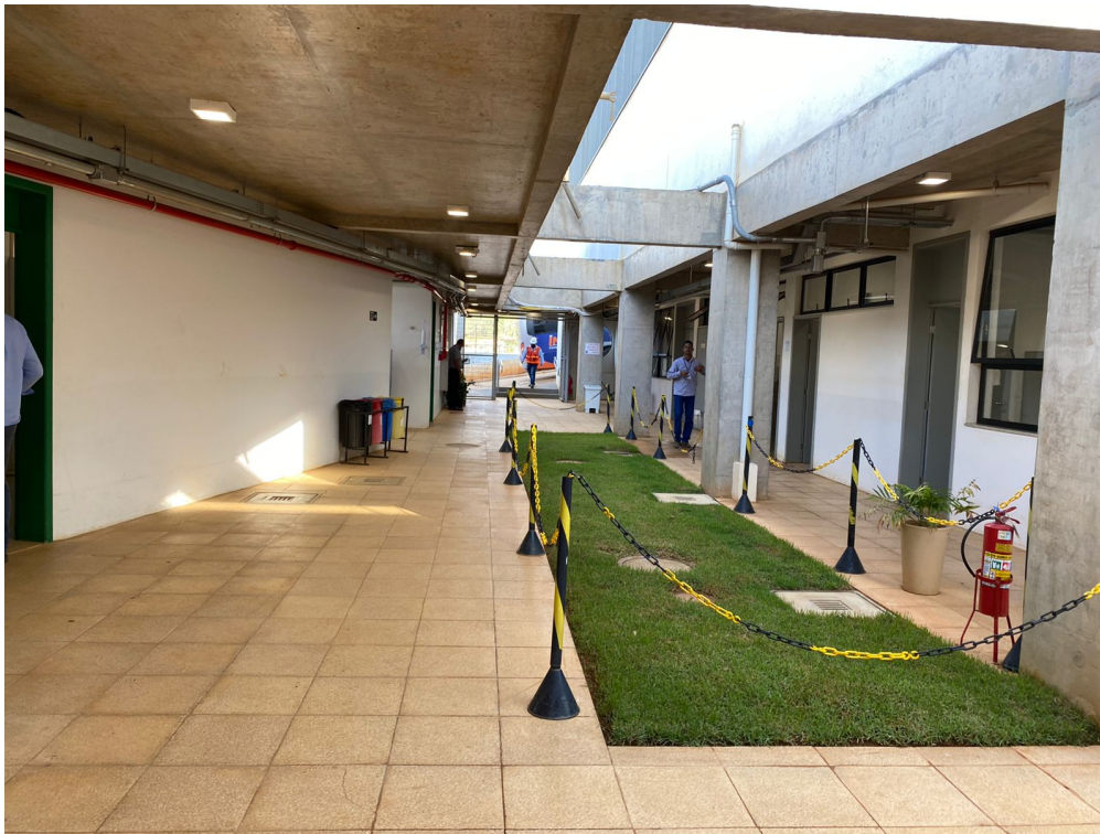
Foto 16 - Sala multifuncional e escada para o Ginásio da Escola