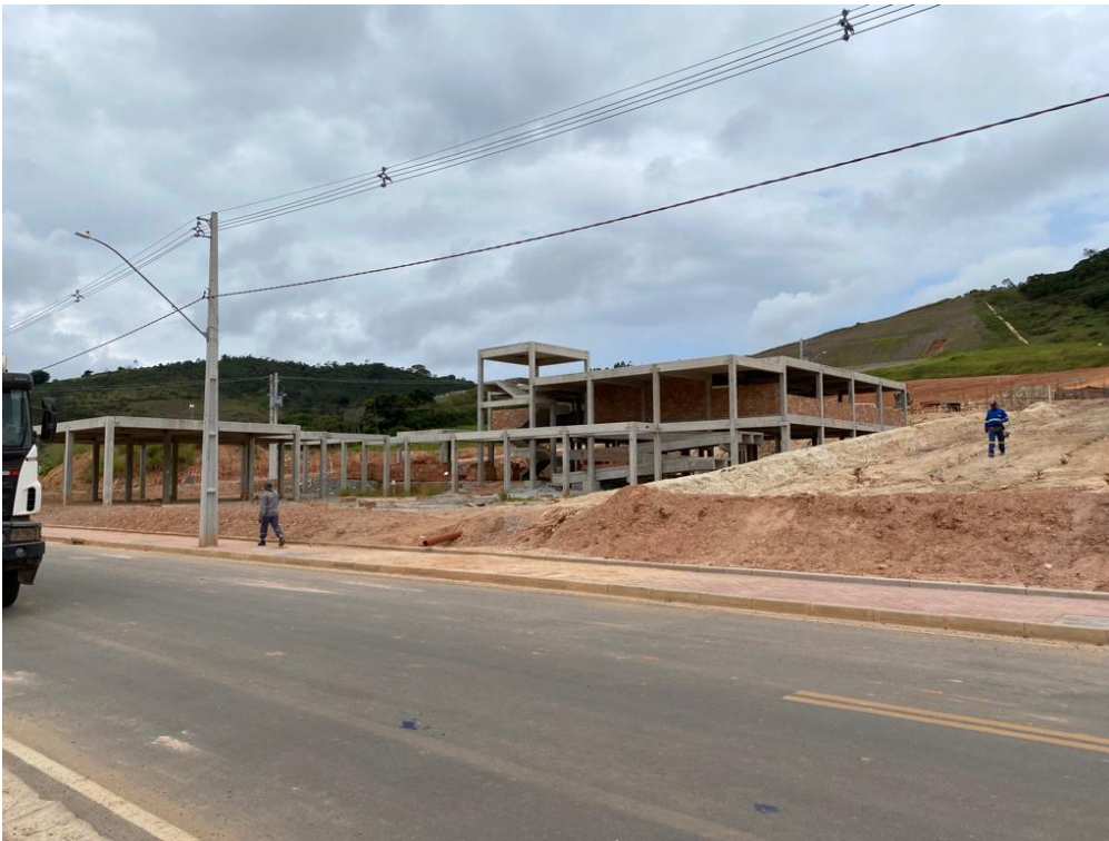
Foto 6 - Equipe da CT-Infra, Prefeitura de Mariana, EY e Renova