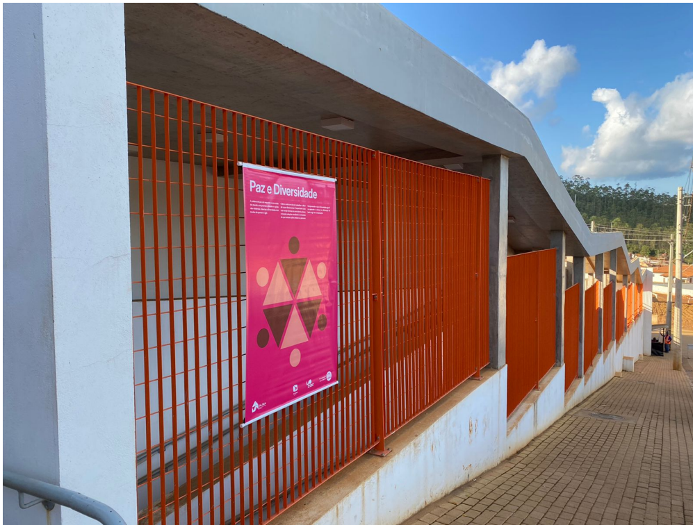
Foto 19 - Ginásio da Escola