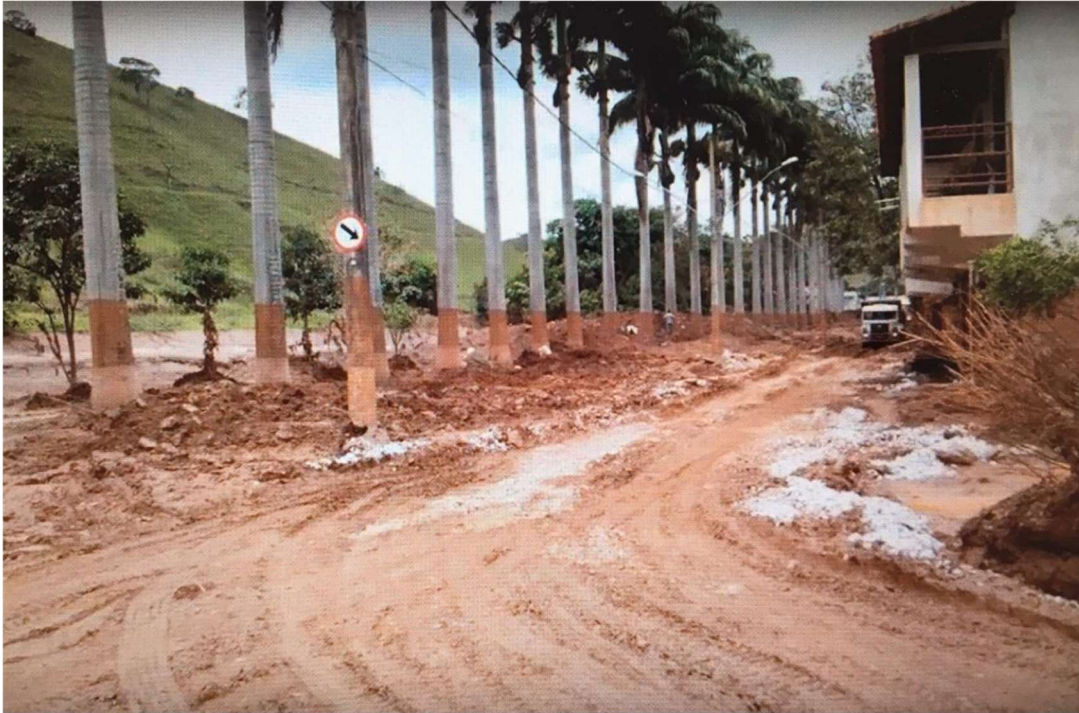
Imagem 3 - Barra Longa - Rua Beira Rio após início da retirada da lama de rejeitos. (Youtube, 2020)