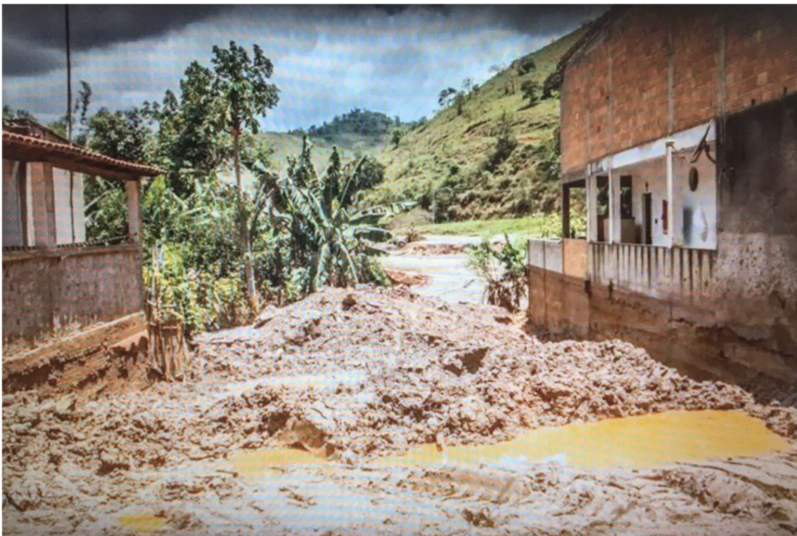
Imagem 6 - Barra Longa - lama entre imóveis. (Youtube, 2020)