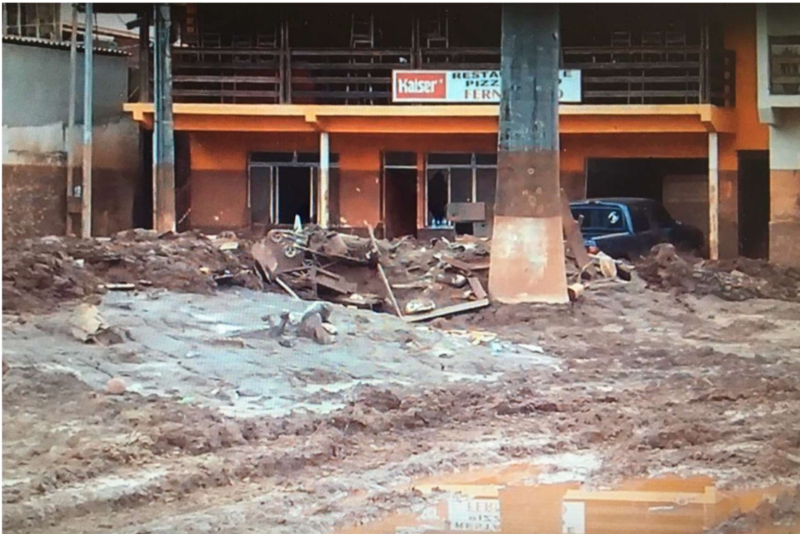
Imagem 5 - Barra Longa - Imóveis do comércio local tomados pela lama de rejeitos.