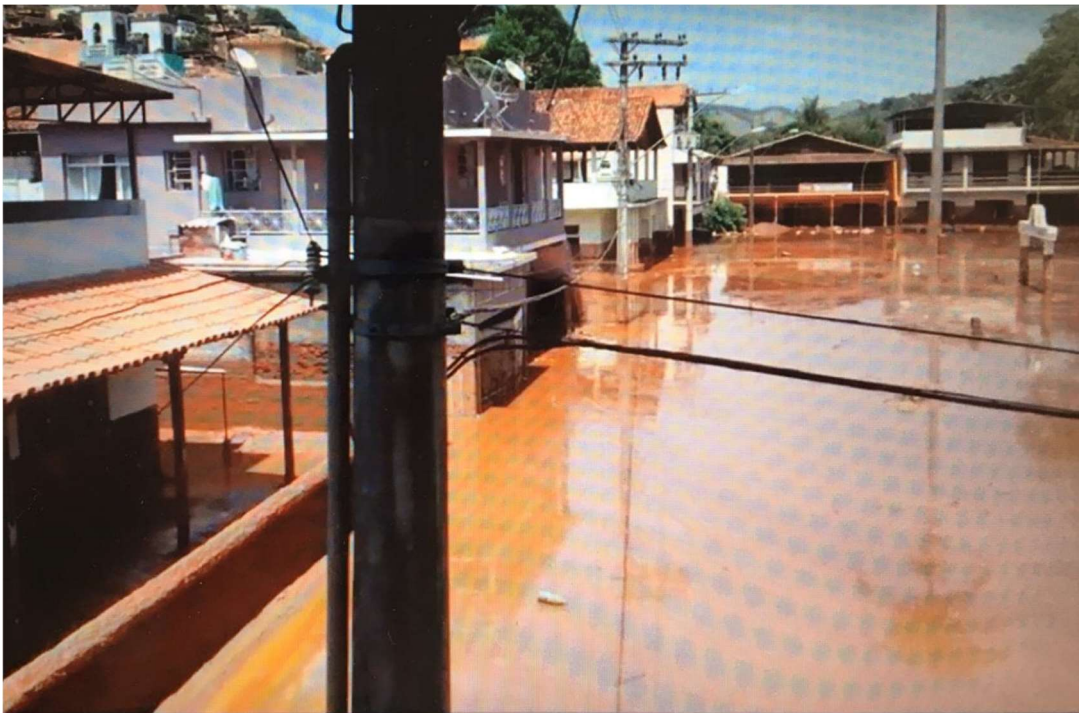
Imagem 4 - Barra Longa - Praça Manoel Lino Mol e edificações do entorno alagadas pela lama de rejeitos. (Youtube, 2020)