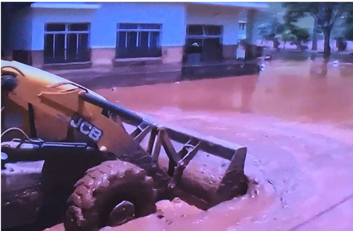
Imagem 8 - Barra Longa – Limpeza da lama e marcação da altura atingida em Imóveis centrais. (Youtube, 2020)

REFERÊNCIA das capturas de imagem: YOUTUBE. SÉRGIO, Raimundo. “Barra Longa Antes e Depois da Lama da Samarco”, disponível em < https://www.youtube.com/watch?v=20pugNKLZts >. Acesso em 11/03/2020