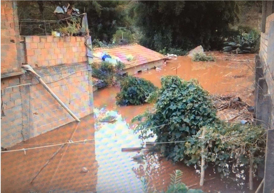
Imagem 7 - Barra Longa – Imóveis submersos na lama.