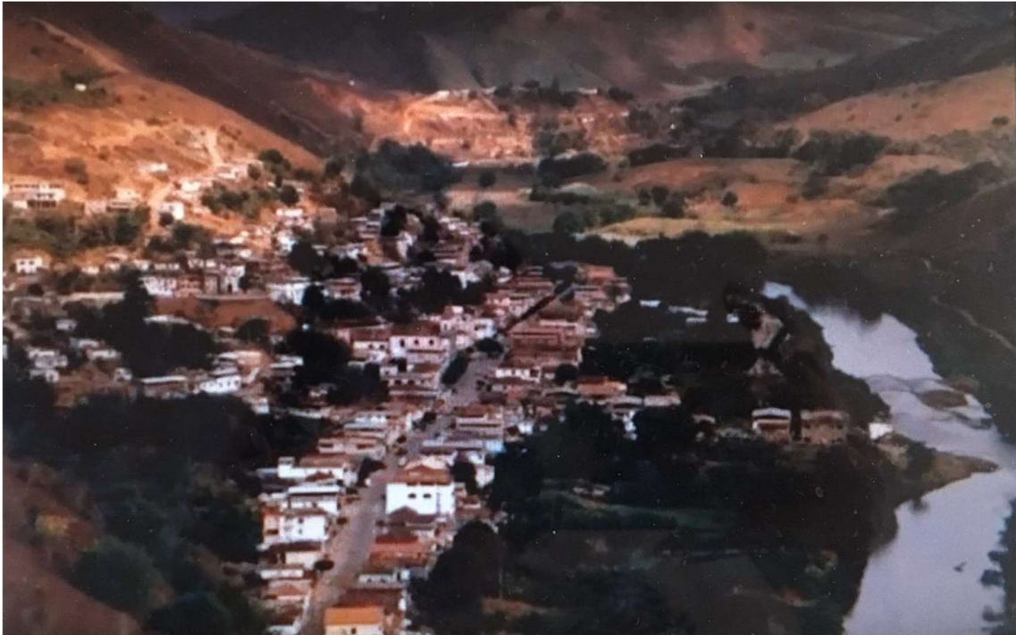
Imagem 1 - Município de Barra Longa - Imagem aérea do centro urbano antes da chegada da lama. (Youtube, 2020)

Anexo de finalidade apenas ilustrativa. A seguir imagens da passagem da lama na sede do município de Barra Longa que ilustram a causa do impacto nos imóveis.