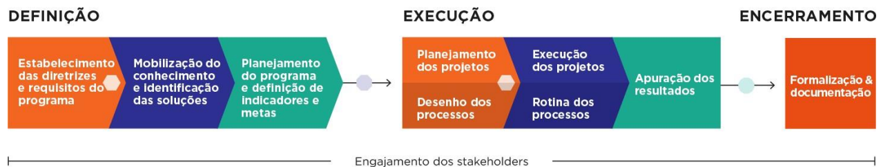
Figura - Metodologia de Desenvolvimento dos Programas em três etapas.

A figura abaixo demonstra a abordagem metodológica utilizada para desenvolvimento dos programas que estão sob responsabilidade da Fundação Renova (Fundação).