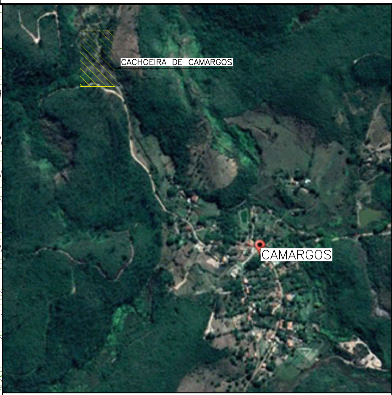
PLANTA CHAVE SEM ESCALA