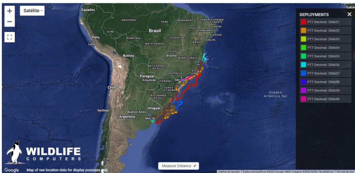
Figura 1 - Até o momento, 01 dos 10 transmissores instalados em 2020 para telemetria de Caretta caretta está em funcionamento, permitindo a coleta dos dados.