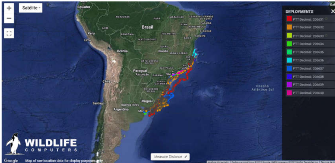
Figura 1 - Até o momento, 01 dos 10 transmissores instalados em 2020 para telemetria de Caretta caretta estão em funcionamento, permitindo a coleta dos dados.