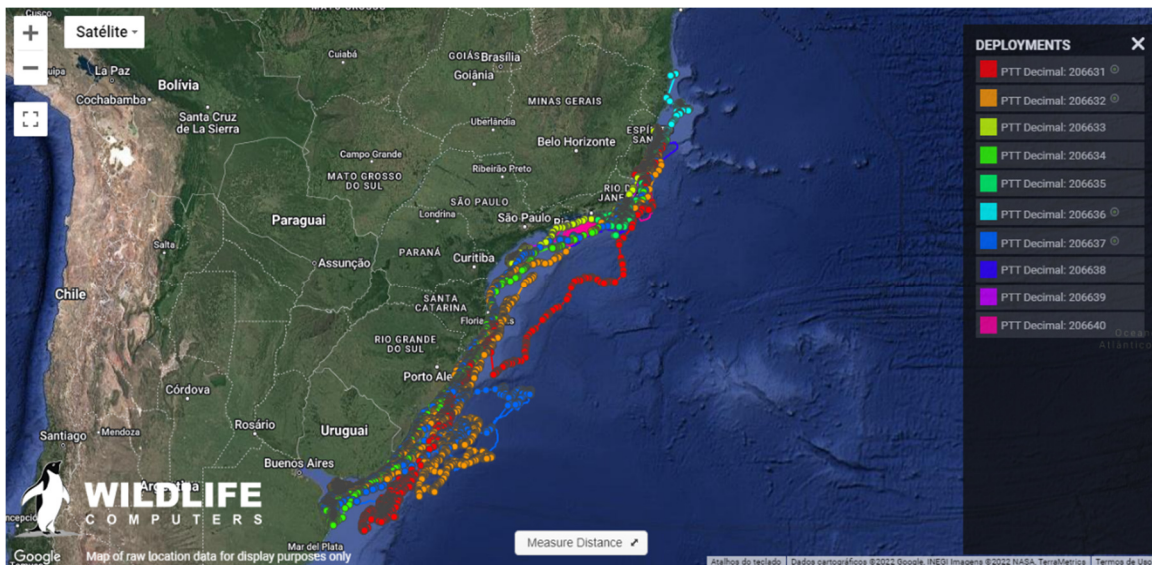
Figura 1 - Até o momento, 04 dos 10 transmissores instalados em 2020 para telemetria de Caretta caretta estão em funcionamento, permitindo a coleta dos dados.