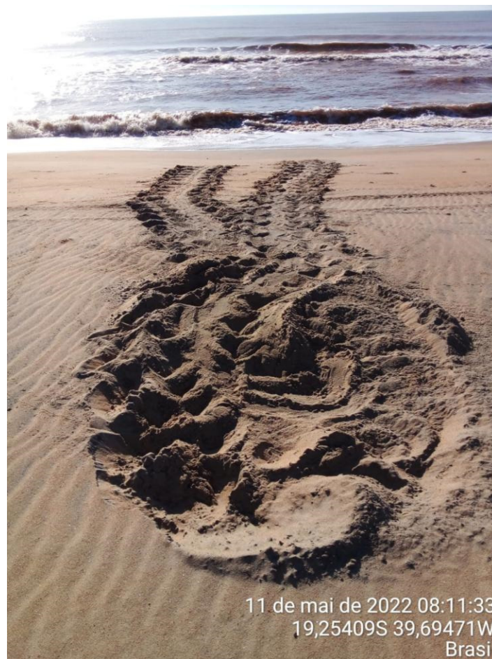
Figura 3 - Registro Reprodutivo, Base de Pontal do Ipiranga (2022).