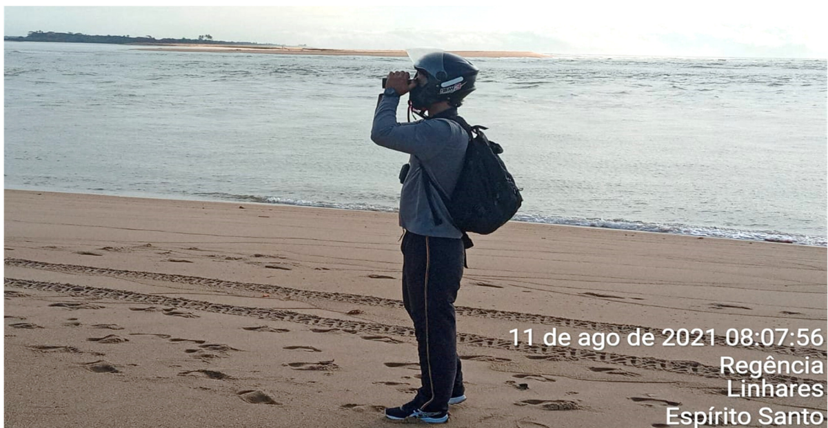
Figura 3 - Apoio a pesquisa, Rede Rio Doce Mar (RRDM), pesquisador avifauna, Base de Regência.