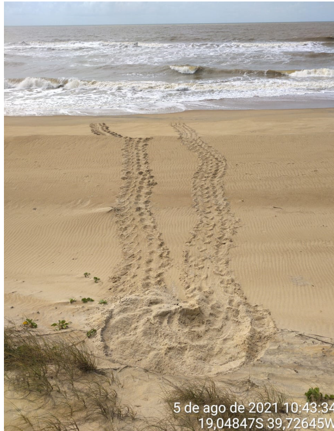
Figura 3 - Primeiro registro reprodutivo da temporada 2021/22, Base de Pontal do Ipiranga.