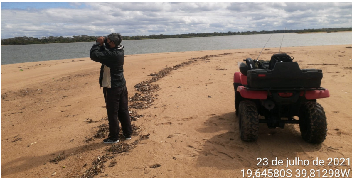
Figura 2 - Apoio a pesquisa, Rede Rio Doce Mar (RRDM), pesquisador avifauna, Base de Povoação.