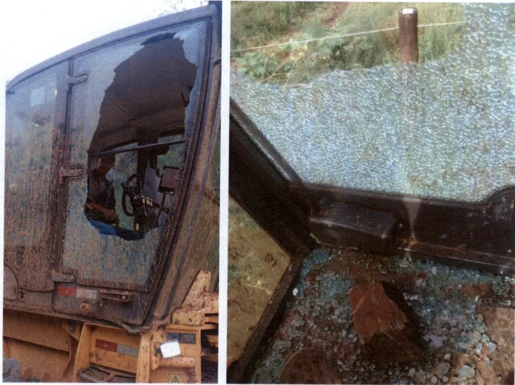
FIGURAS 1 E 2 – TRATOR DANIFICADO EM UM PROTESTO EM BARRA LONGA.