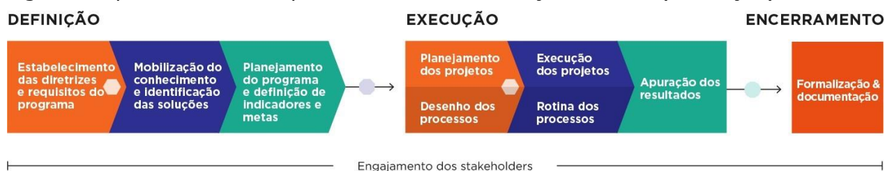
FIGURA 1. Ciclo de vida do programa

A figura abaixo demonstra a abordagem metodológica utilizada no desenvolvimento dos programas que estão sob responsabilidade da Fundação Renova (Fundação).