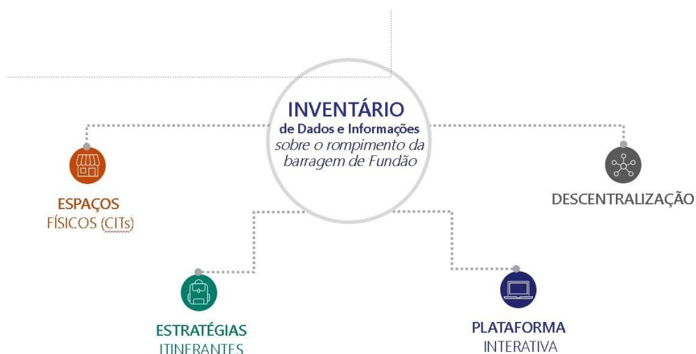
FIGURA 2. Diagrama síntese das ações do Programa

As ações realizadas pelo Programa são destinadas a todas as comunidades e pessoas atingidas - entre elas pessoas idosas, adultos, jovens e crianças – bem como às demais partes interessadas em informações sobre as localidades atingidas, o rompimento e suas consequências e o processo de reparação e compensação. Dentro desse público estão incluídas autoridades, sociedade civil, setor privado, pesquisadores e educadores, entre outras pessoas que queiram conhecer e aprender sobre essas temáticas.