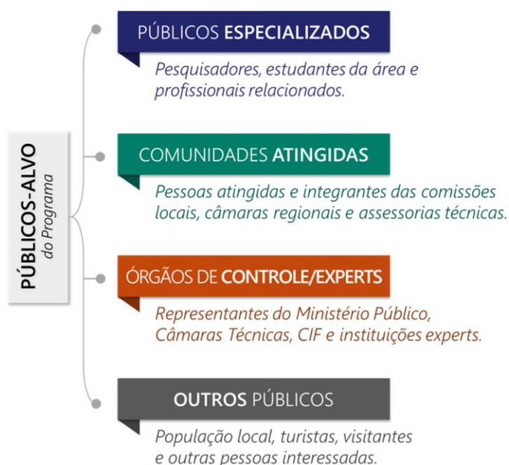
FIGURA 3. Públicos-alvo do Programa

As ações realizadas pelo Programa são destinadas a todas as comunidades e pessoas atingidas - entre elas pessoas idosas, adultos, jovens e crianças – bem como às demais partes interessadas em informações sobre as localidades atingidas, o rompimento e suas consequências e o processo de reparação e compensação. Dentro desse público estão incluídas autoridades, sociedade civil, setor privado, pesquisadores e educadores, entre outras pessoas que queiram conhecer e aprender sobre essas temáticas.