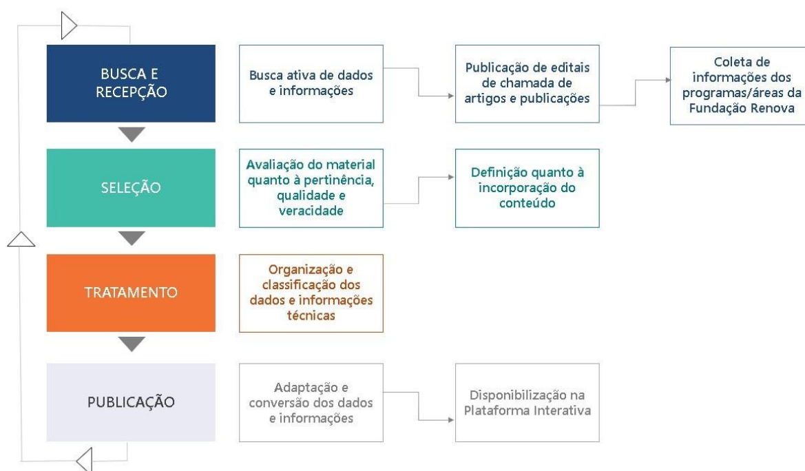
Diagrama do Processo