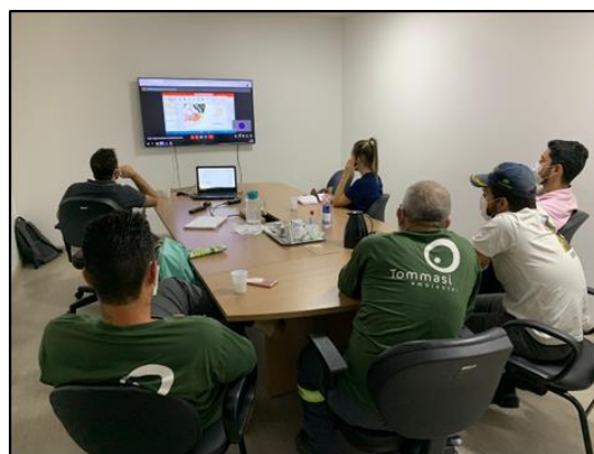
Figura 2. Treinamento de coletores de campo do laboratório Tommasi.