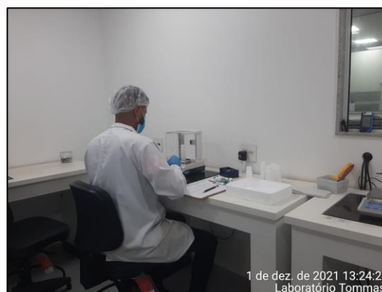
Figura 4. Pesagem das amostras de sedimentos