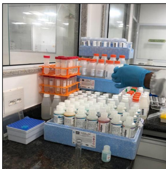
Figura 9. Preparo dos padrões