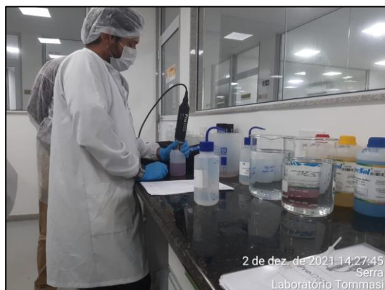
Figura 13. Calibração da sonda YSI - Pro DSS