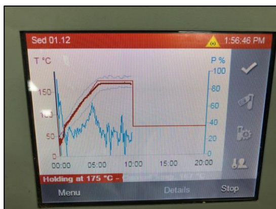
Figura 7. Microwave digestion system - Multiwave GO