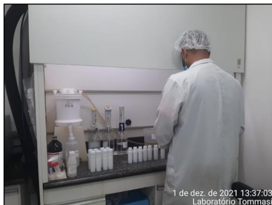
Figura 5. Preparo das amostras de sedimentos