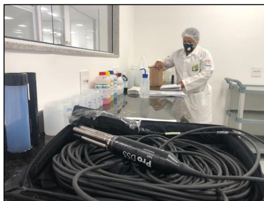
Figura 14. Checagem da sonda YSI - Pro DSS