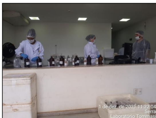
Figura 3. Recebimento das amostras