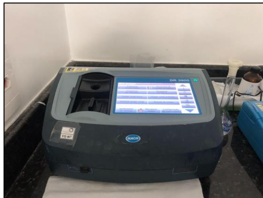
Figura 12. Espectrofotômetro DR3900 visível - análise de Nitrato, Nitrito, Nitrogênio amoniacal e sulfato.