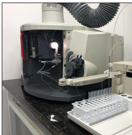
Figura 10. ICP-OES