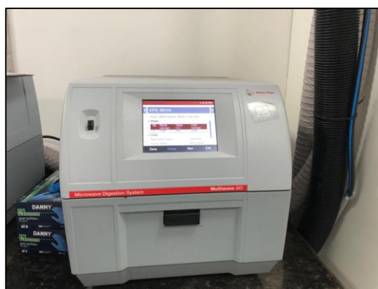
Figura 8. Microwave digestion system - Multiwave GO