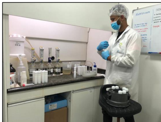
Figura 6. Colocação das amostras no rotor do micro ondas