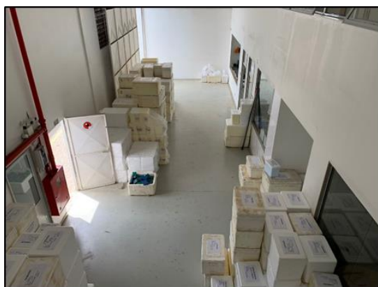
Figura 1. Preparação de caixas com frascaria para campo.