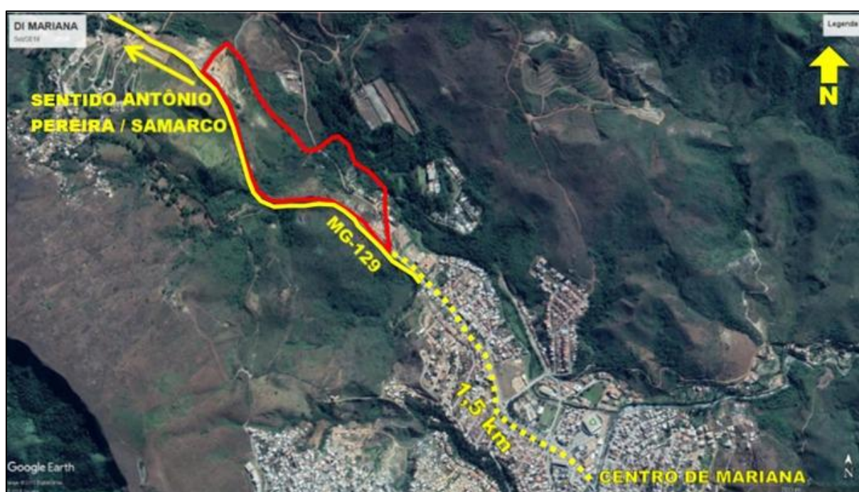
Imagem 1 – Foto aérea do espaço escolhido

A área escolhida está localizada a margem direita da rodovia MG-129 (Sentido Antônio Pereira e Samarco), a uma distância de aproximadamente 1,5 km do centro urbano de Mariana. Em 2004 foi votado o projeto de lei 387/2004 3 destinando o uso da área para o distrito empresarial de Mariana. Trata-se de um espaço com 216.349,33 m 2 , com área útil de 67.587,30 m 2 , onde serão disponibilizados 11 lotes. A ilustração da área está descrita na seguinte imagem 1: