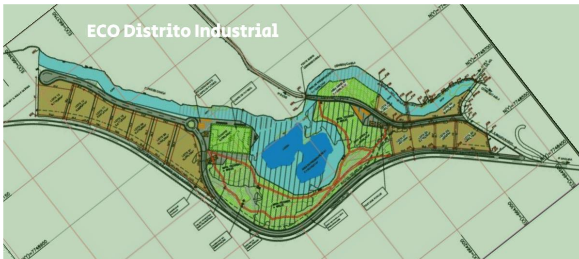
Imagem 2 – Projeto do Distrito Empresarial

Fonte: Prefeitura de Mariana - Secretaria de Obras (anexo 5) 4