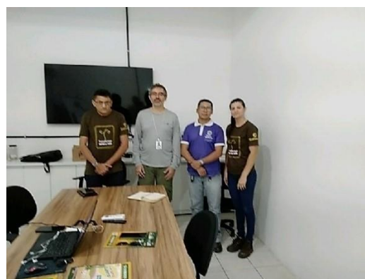
Foto 2 – Registro da Aplicação de Questionário com o Liderança da Comunidade de São Damião, Presidente da Associação de Apicultores de Santa Quitéria, Técnicos Amplo e Técnicos do CSQ – 12/07/2023