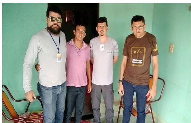
Foto 1 – Registro da Aplicação de Questionário com o Presidente da Colônia de Pescadores de Santa Quitéria – Vila São Damião, Técnicos Amplo e Técnicos do CSQ - 10/07/2023

Importa mencionar que o CSQ, por meio de funcionários diretos, acompanhou todas as entrevistas in loco, apresentando os pesquisadores da Amplo Engenharia aos moradores e garantindo que fossem cumpridas todas as boas práticas de saúde e segurança, e comunicação social.