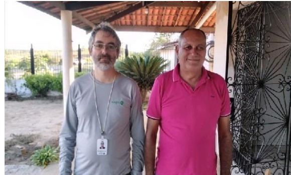
Foto 3 – Registro da Aplicação de Questionário com Liderança do Projeto de Assentamento Quixabá - Itatira – 20/07/2023