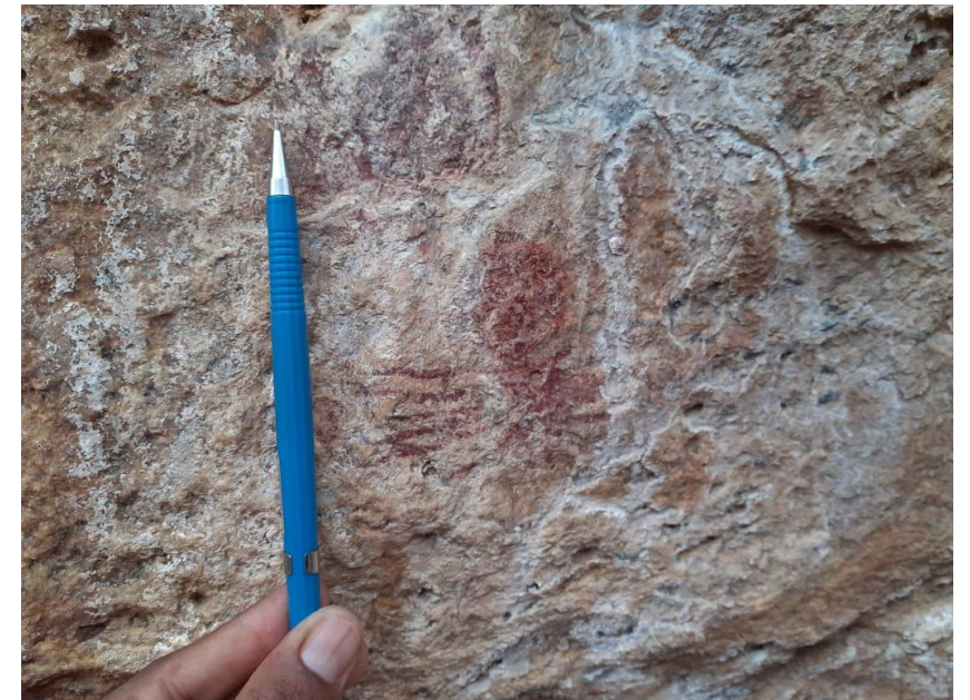
Sítios 1 e 2