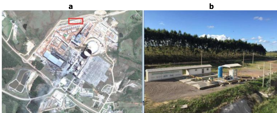
Figura 2 – Localização da Unidade de Biofixação de CO 2 na UTE Candiota III.

A Unidade de Biofixação de CO 2 por Microalgas é uma instalação industrial, que utiliza o gás de combustão, rico em CO 2 , para a produção de biomassa a partir do cultivo de microalgas, promovendo a biofixação do CO 2 . A Unidade encontra-se instalada na área industrial da Usina Termoelétrica Candiota III Fase C, como pode ser visualizado nas Figuras 2a e 2b.