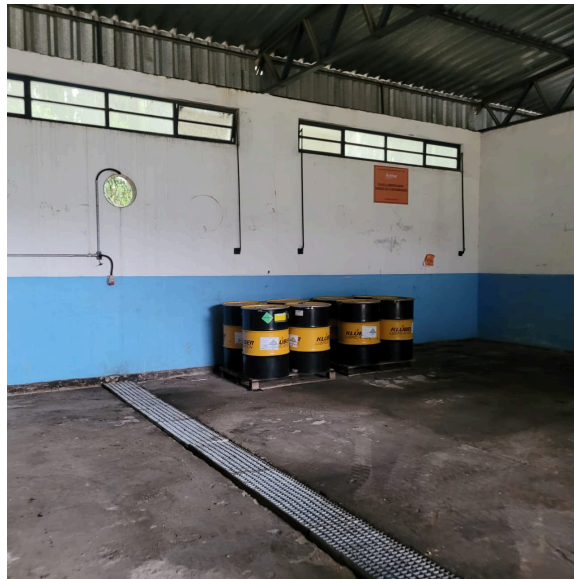
Foto 18: Depósito 2 - Resíduos Perigosos: detalhe do sistema de drenagem