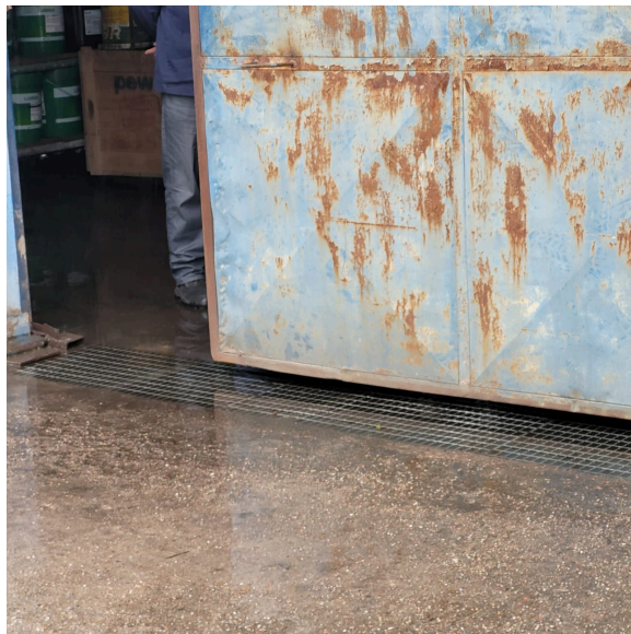
Foto 15: Almojarifado - Galpão de Lubrificantes: detalhe da drenagem do galpão