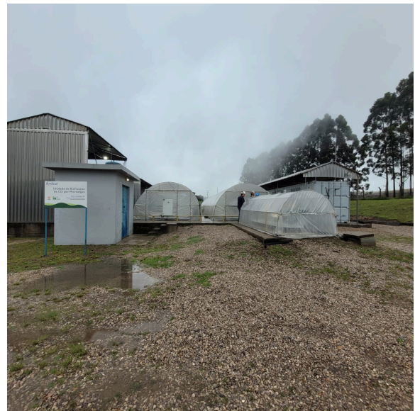
Foto 12: Projeto Semi Industrial de Biofixação de CO2 com Microalgas.