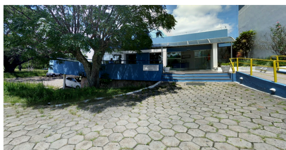
Foto 20: Antiga Sede da Eletrosul - prédio cedido ao município de Candiota