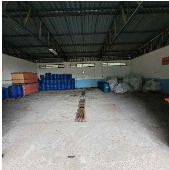
Foto 17: Depósito 1 - Resíduos Perigosos: detalhe do sistema de drenagem