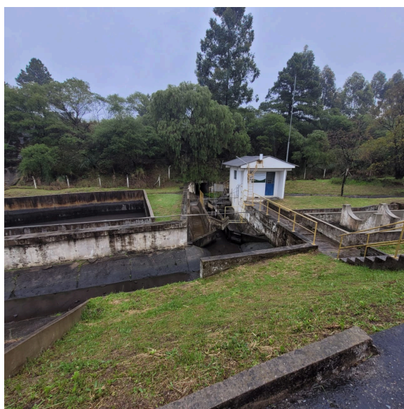
Foto 19: Sistema de Bacias de Contenção - Ponto de lançamento do Efluente Final