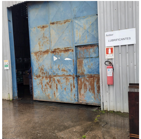
Foto 14: Almojarifado - Galpão de Lubrificantes