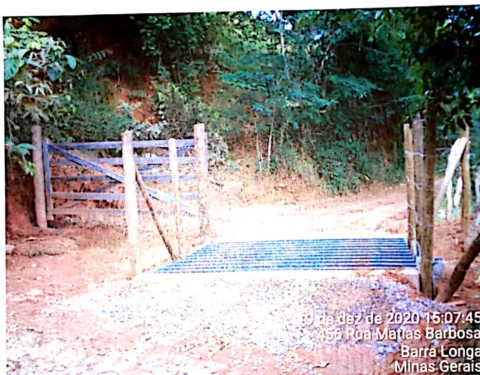
VISTA DO MATA BURRO JÁ INSTALADO

Local e data: Barra Longa , 02 , Fevereiro de 2020 2021