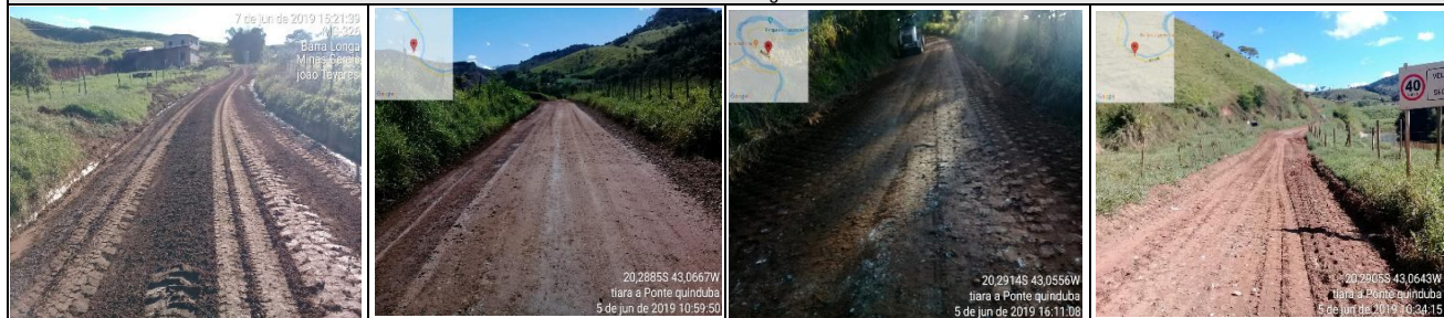
Evidências fotográfica (Depois)