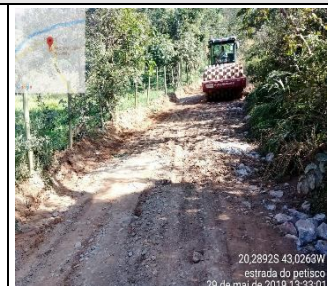
Evidências fotográfica (Depois)