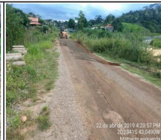
Evidências fotográfica (Depois)