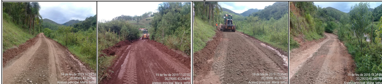
Evidências fotográfica (Depois)