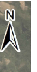
MAPA SEM ESCALA