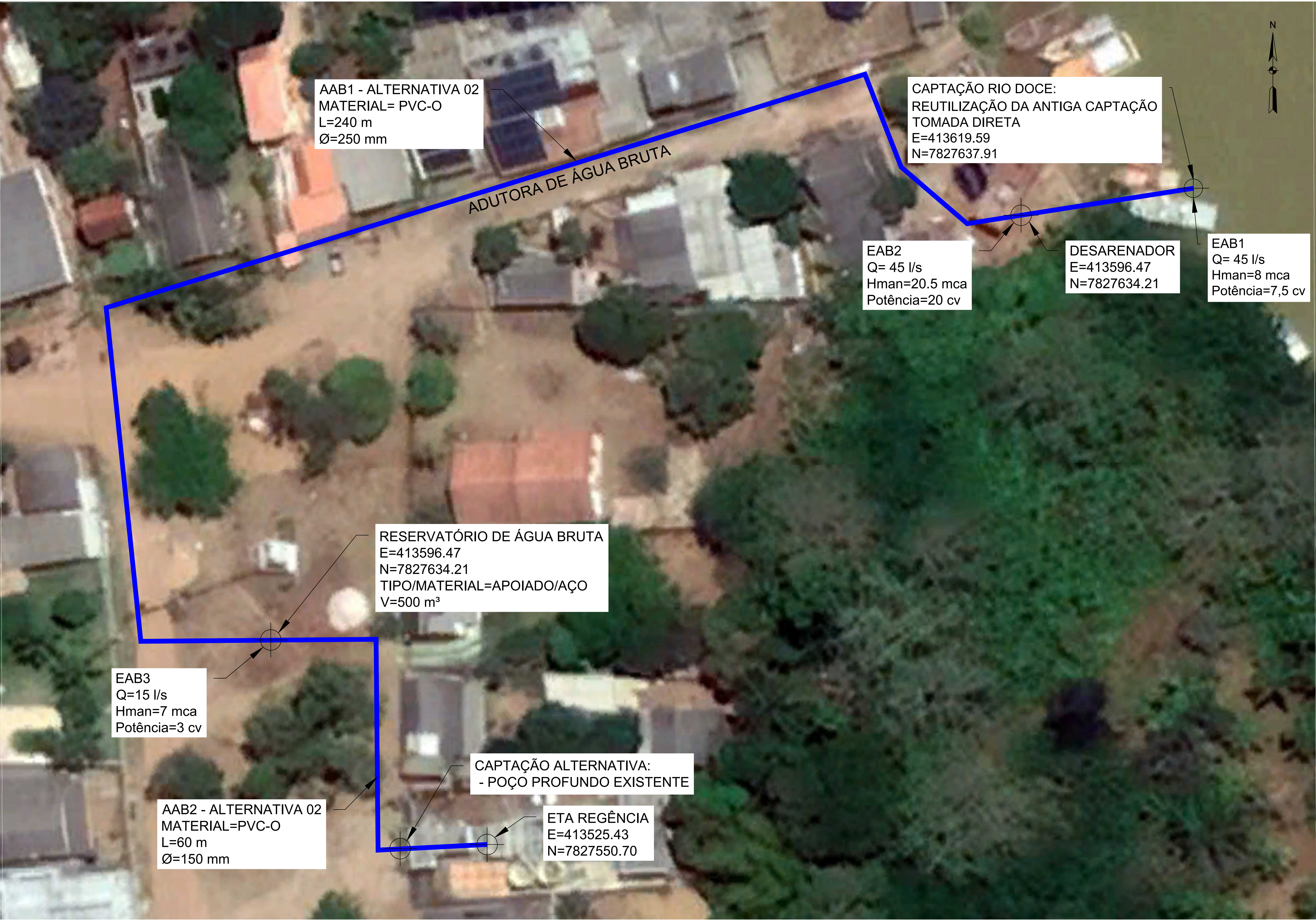
DESENHO ESQUEMÁTICO ESC. 1:250