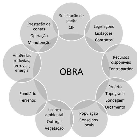
Figura 2: Ações necessárias para a conclusão das obras

Nesse sentido, é muito importante que a equipe do Município esteja engajada nos processos, entendam a responsabilidade de cada parte envolvida e tenham atenção