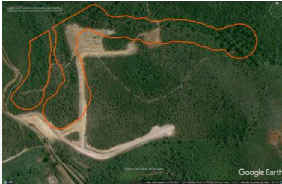
Figura 8 – Área consolidada na propriedade do aterro de Mariana, Google Earth 09/24/2003.

Observou-se que na imagem fornecida pelo software Google Earth data de 24 de setembro de 2003 havia solo exposto em parte da APP, conforme figura abaixo: