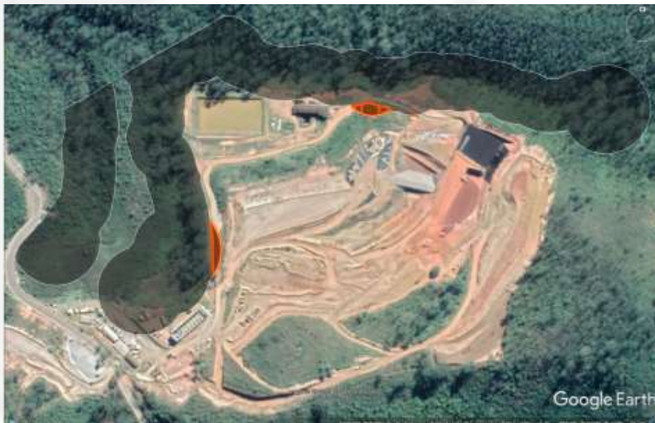
Figura 6 – Porções de APP (em preto), em área passível de intervenção (em vermelho).

Haverá também uma intervenção de 0,08 ha sem supressão de vegetação nativa na APP do córrego Lavoura para instalação de dispositivos de sustentação do aterro, conforme imagem abaixo: