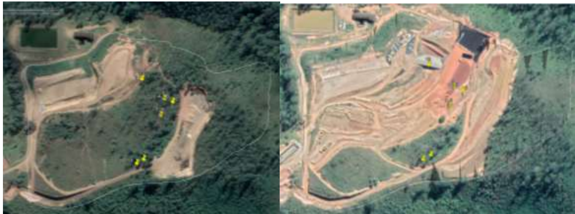
Figura 3– ADA do aterro de Mariana em 2017 e imagem atual de 2020, software GoogleEarth

O aterro realizou intervenção ambiental durante a operação sem licença ambiental vigente, como mostra na imagem de satélite do software Google Earth: