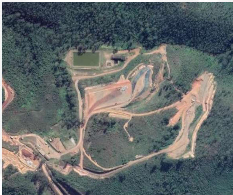
Figura 1 – Aterro sanitário de Mariana/MG via IDE-SISEMA

Na Figura 1 pode ser observada a área do aterro sanitário via imagem de satélite.