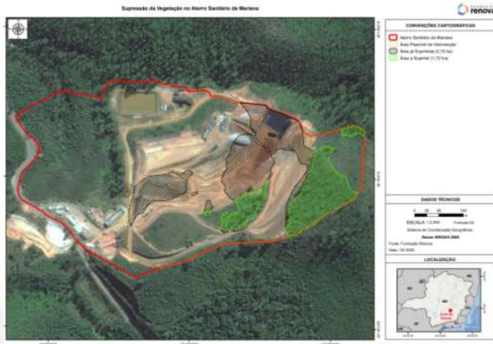
Figura 5 – Áreas intervindas e áreas a intervir no aterro de Mariana

De acordo com o uso do solo e censo apresentado, houve supressão de 2,70 ha de vegetação herbácea/arbustiva/rebrota de Eucalyptus sp e gramínea com árvores isoladas fora de APP.