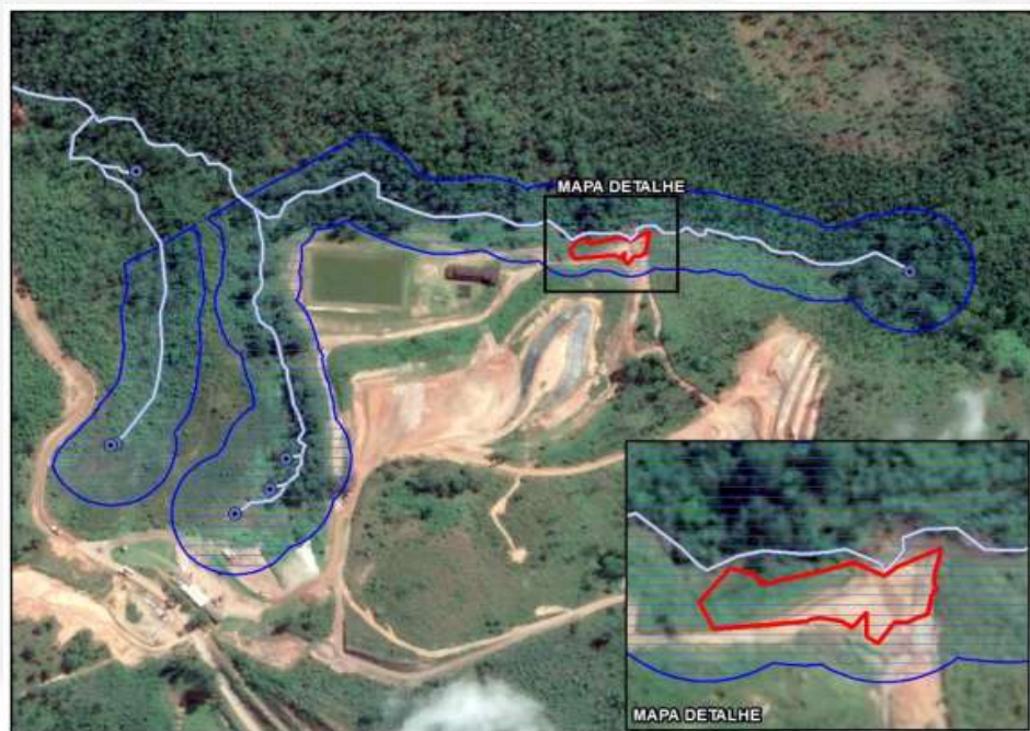
Figura 7 – Área proposta para compensação

Não há previsão de supressão da vegetação em Áreas de Preservação Permanente (APP). No PTRF apresentado (Tractebel Engie – Março/2020) foram declaradas duas porções de APP dentro da área de intervenção do empreendimento (Fig 7). A proposta de compensação decorrente da intervenção em 0,08 ha de APP do Córrego Lavoura infere-se na recomposição de uma área, também de preservação permanente, com plantio de mudas de espécies nativas, segundo critérios estabelecidos pela Instrução de Serviço SEMAD nº 04/2016. A reconstituição da flora será realizada em áreas cujas dimensões equivalem à área de intervenção, dentro dos limites do aterro sanitário de Mariana, localizada na sub-bacia do Córrego Lavoura (Fig 8).