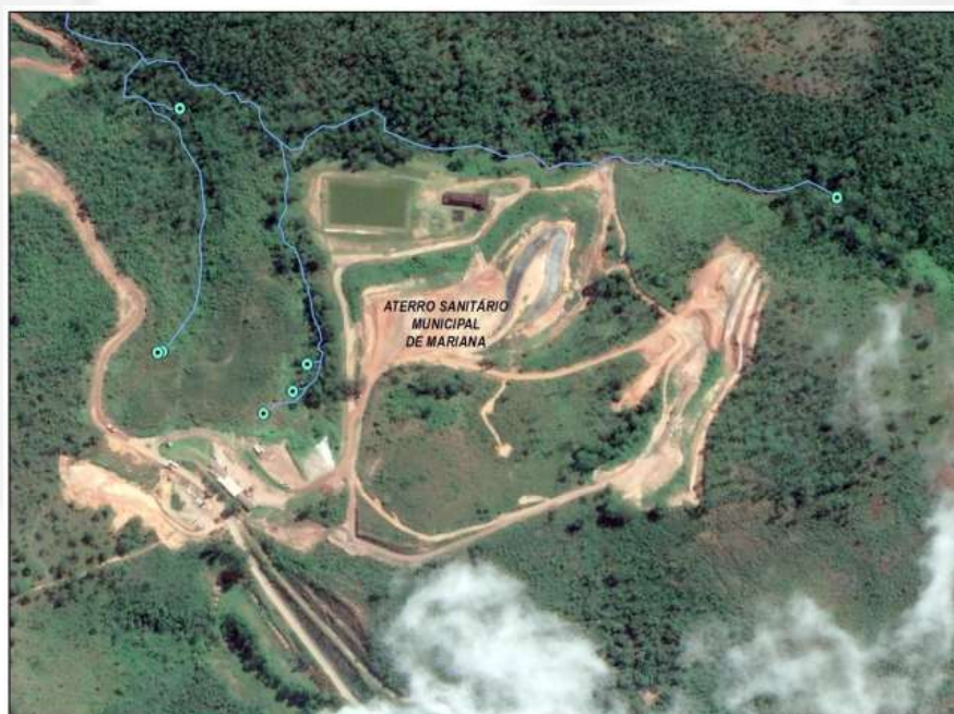
Figura 2 – Cursos d'água e nascentes identificadas no entorno do empreendimento.

A Figura 2 abaixo ilustra os cursos d'águas no entorno do empreendimento com suas respectivas nascentes.