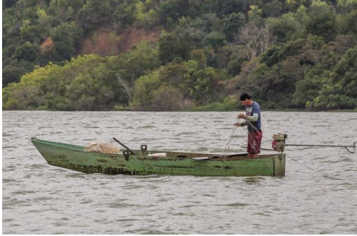
Figura 1: Espelho d'água