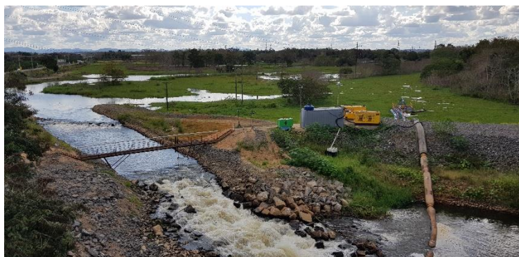
Barramento do Rio Pequeno

Este relatório está dividido em três partes, sendo elas: 1) Resumo dos estudos já realizados pela Fundação Renova e outras entidades; 2) Impactos identificados e ações mitigatórias em curso; 3) Ações de curto, médio e longo prazos para a reparação dos impactos. 4) detalhamento descritivo.