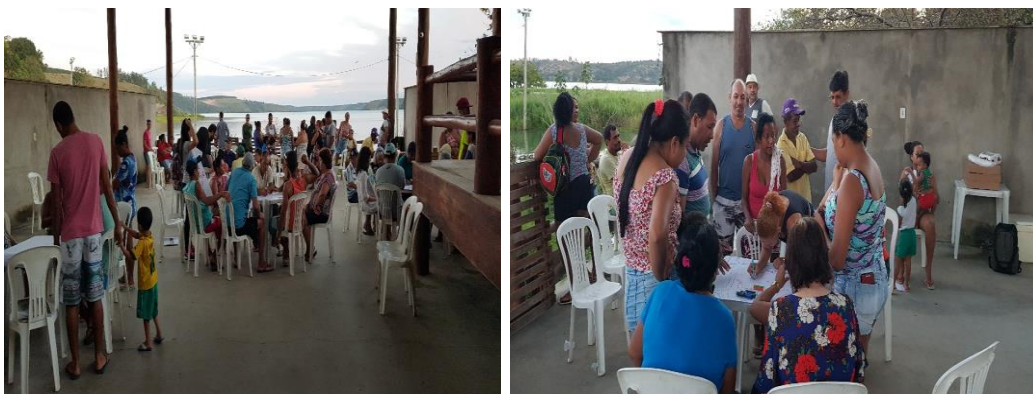
Metodologias de campo

A operacionalização do processo de avaliação dos impactos específicos do barramento do Rio Pequeno foi realizada seguindo 03 etapas lógicas: 1) Construção da "Linha de Base"; 2) Monitoramento longitudinal; 3) Definição analítica da influência do rompimento nos parâmetros avaliados por meio de técnicas metodológicas de a) questionário estruturado; b) entrevista semiestruturada; c) Pesquisa de Campo para identificação de impactos em usos e ocupações; d) Diagnóstico Participativo; e) levantamento de dados secundários; f) Cadastro Integrado; g) Diagnóstico do Turismo em Linhares/ES e Sooretama/ES.