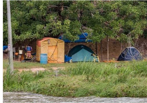
Figura 2: Acompanhamento de pescadores.

As ilhas talvez sejam o tipo de paisagem que mais conserva as características nativas dessa região, obviamente por condições físicas de isolamento, mas também pelo tipo de uso que se dá nesse espaço, muito pontual e pouco agressivo com relação às condições naturais (nativas). Na ilha do Imperador está presente grande parte da vegetação nativa restante.